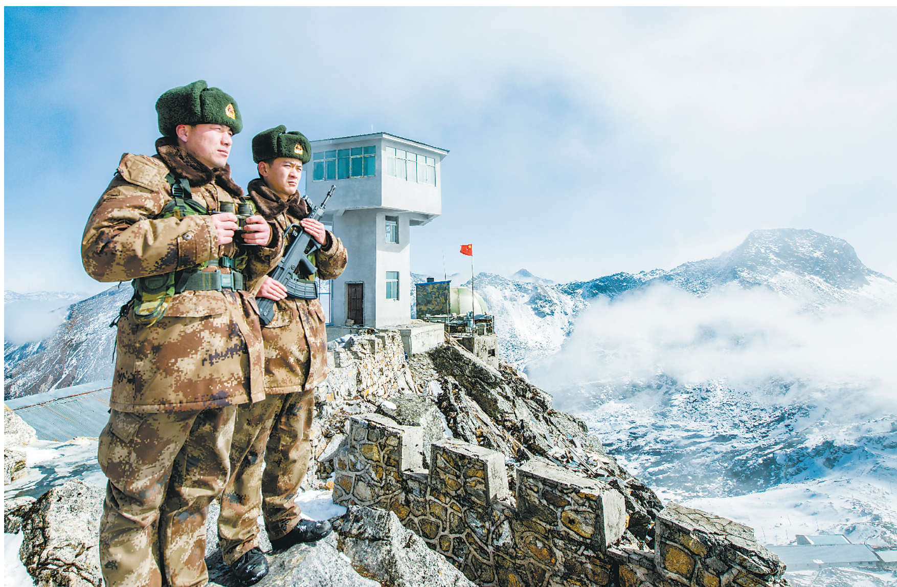
元旦假期，西藏日喀則軍分區邊防官兵節日不忘戰備，緊繃戰弦，頂著嚴寒冰霜到點到地執勤巡邏，為祖國人民歡度新年守衛安寧。邊防官兵們表示：“邊防有我們在，請祖國人民放心！”圖為官兵在海拔4783米的卓拉哨所觀察執勤。