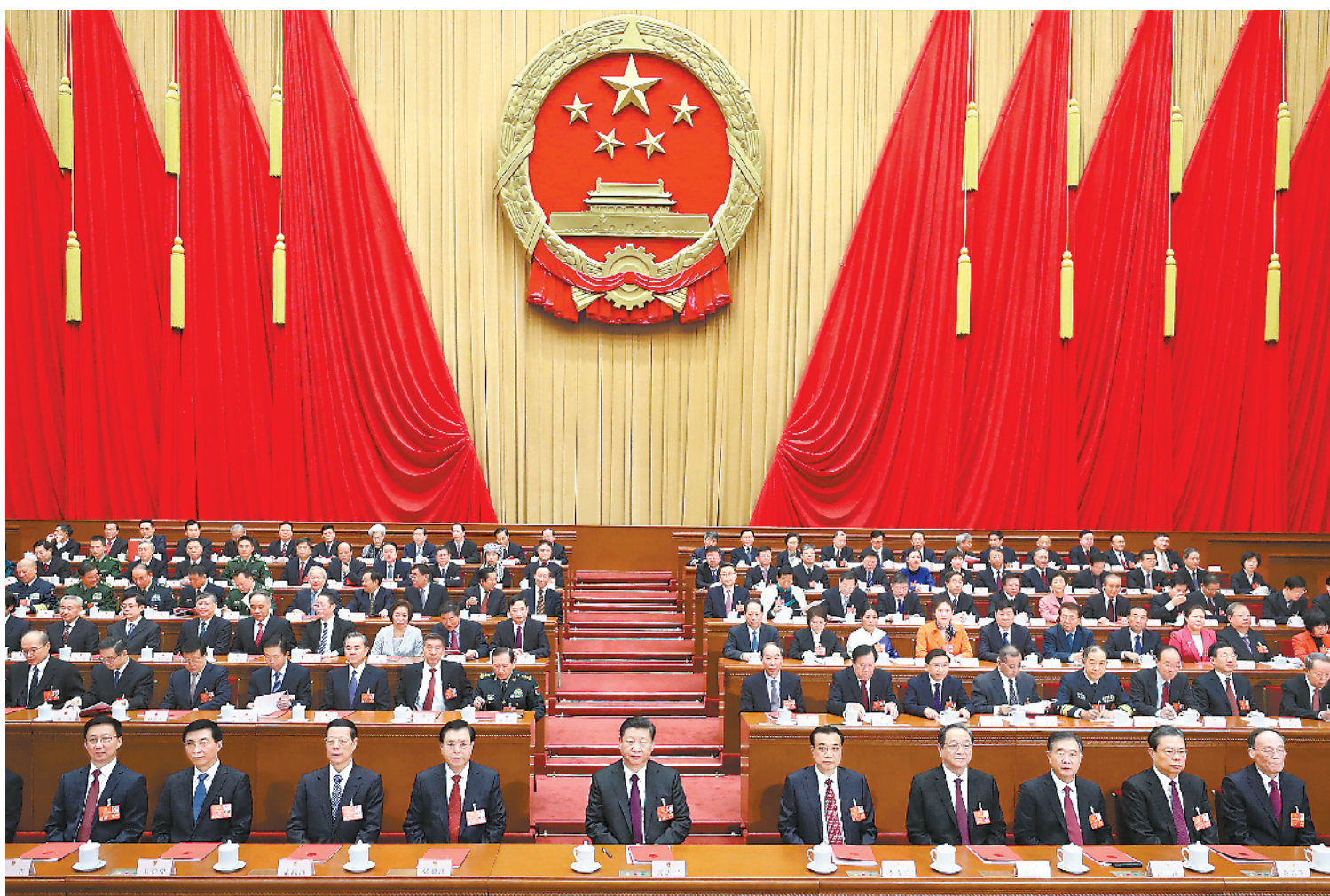
3月20日,第十三屆全國人民代表大會第一次會議在北京人民大會堂閉幕。中共中央總書記、國家主席、中央軍委主席習近平發表重要講話。