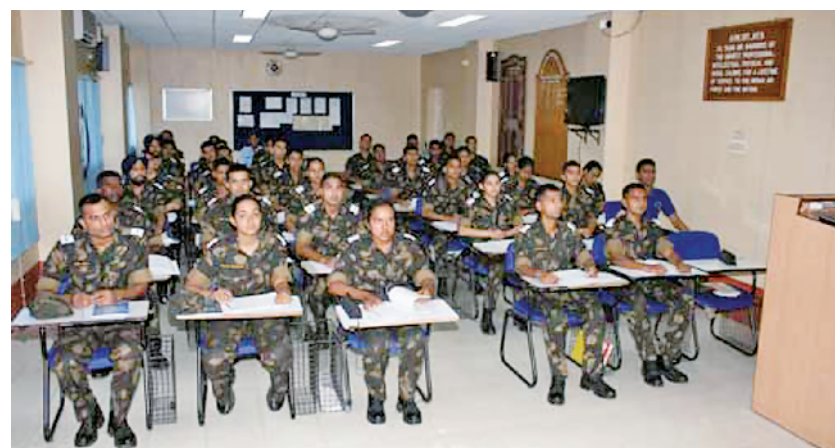
印军相关人员在维斯瓦·巴拉蒂大学学习。

不过,印度能否成功开发这款中文翻译软件让人存疑,中文博大精深,同样的词汇可能会表达完全不同的意思,甚至一句话的语调不同都会产生相当大的歧义,全球知名的大型科技企业都很难做好中文的即时翻译工作,而在军事领域有大量的专业词汇,更是难上加难。再者,连中国人自己都很难精通各种方言,印度企业能够完成这项浩大的工程吗?