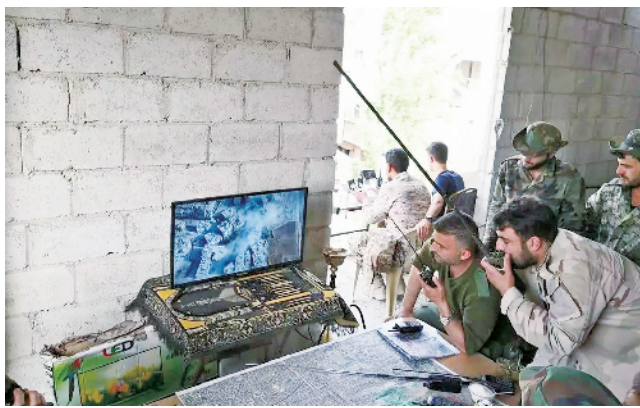
叙政府军通过无人机回传的画面指挥战斗。