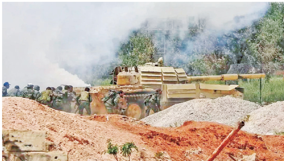
叙政府军用T-72坦克掩护步兵进攻。