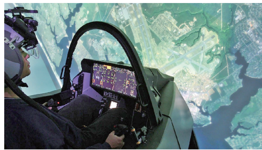
美国空军人员正在进行模拟飞行训练。

报告指出,这样一种“非正式”的态度和做法,让五角大楼在划拨援助资金和装备时,几乎无法受到国会监督。“议员们只需要表达‘支持’或‘不支持’就行了,五角大楼不会向他们解释原因,事后也不会因为某笔援助资金出了问题而承担责任。如果五角大楼能把评估和监督程序做得更正式一些,议员们就会了解某个援助项目存在什么风险、会产生何种收益以及进行的程度如何,从而对五角大楼的大笔资金和装备调动进行真正的审查和监督。”