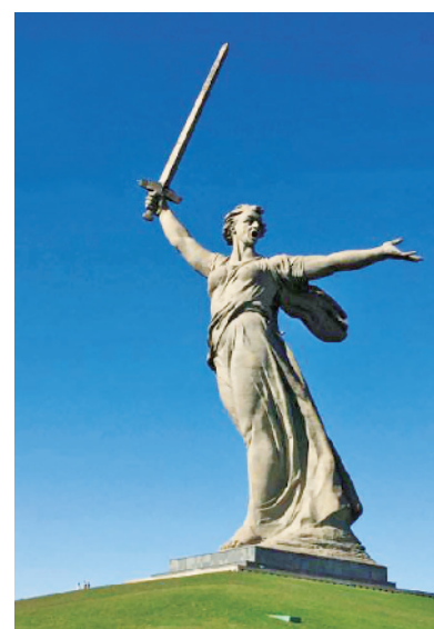
为纪念斯大林格勒战役而建立的“祖国母亲在召唤”雕像。

违背规律埋下失败祸根。斯大林格勒战役，是苏德统帅部战略博弈的结果。从整个决策过程看，以希特勒为首的纳粹德军高层，在这场战役中作出了很多错误决策。德国陆军1942年3月的一份报告显示，“东线全部162个作战师中，只有8个师还有进攻的能力，16个装甲师中，只剩下140辆坦克可供使用——这比过去一个师的正常数字还要少”。可以说，德军已经到了“强弩之末不可以穿鲁缟”的地步。但希特勒坚持认为，“俄国已到了势穷力竭的地步”，执意发起夏季攻势。研究德军战史的英国人希顿指出，希特勒“在战略上胃口过大，本身缺乏兵力，又固执地低估敌人的兵力和潜力”。另外，按照德国军事理论家克劳塞维茨的观点，“兵力愈弱，则愈应使用少数的兵力，在其他各地点牵制敌人，以期在决胜点上，彻底集中优势兵力”。希特勒却一再违反集中兵力原则，多次犯了战场分兵的兵家大忌。在战役关键时刻，把其他3个集团军派往高加索方向抢占油田，导致第6集团军既要攻下斯大林格勒，又要建立顿河防线，德军有限的进攻力量被分散得七零八落，在广袤的战场上根本形成不了战场优势，反而给了