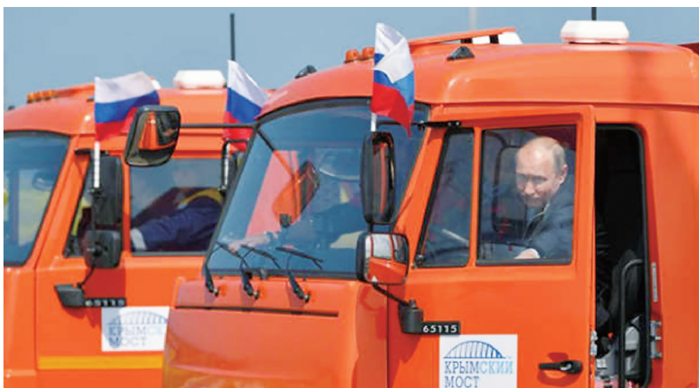
5月,连接克里米亚和克拉斯诺达尔的跨刻赤海峡大桥举行部分通车仪式,普京驾车验收。

当然,美国对于土耳其的种种做法自然不会善罢甘休。就在7月24日,美国众议院通过“2019财年国防授权法案”,其中包括暂停向土耳其交付F-35战机。对于特朗普所称的对土耳其的制裁,有专家推测称,美国政府将对土耳其高级官员进行签证限制,但目前并未得到相关部门证实。未来美土关系走向何处,引人深思。