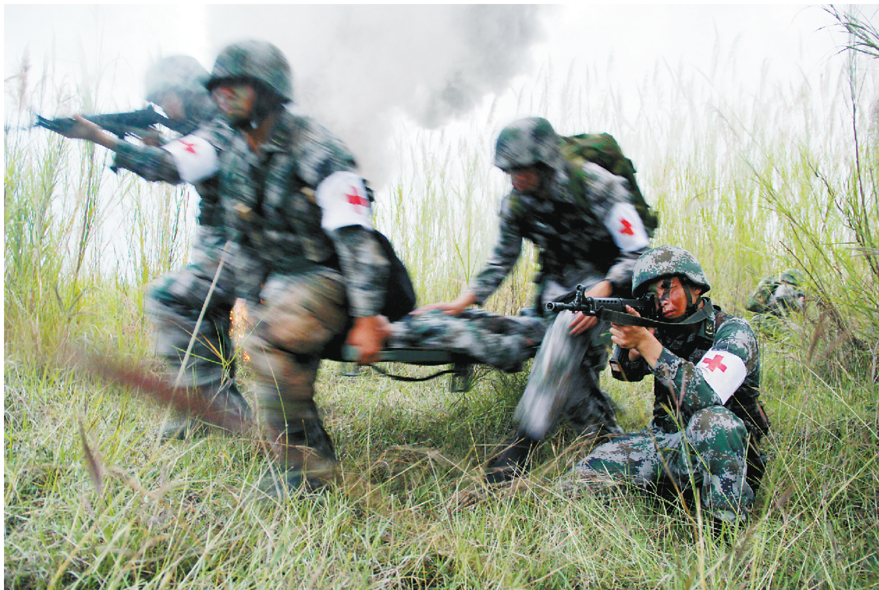
8月上旬,南部战区陆军某边防旅组织陌生地域战场卫勤保障综合演练,提高官兵战场救护能力。图为官兵开展卫勤演练。

收集汇总军人家属就业、子女教育需求;各县、区每年由同级人力资源和社会保障部门统一安排一次定向招聘考试,组织用人单位和随军家属进行双向选择;每年9月底前,对各县(区)相关部门和学校贯彻落实优待政策情况进行通报;随军家属安置纳入党管武装考评指标,对完不成年度安置任务的县(区)和单位,不得参加当年双拥先进单位评选。