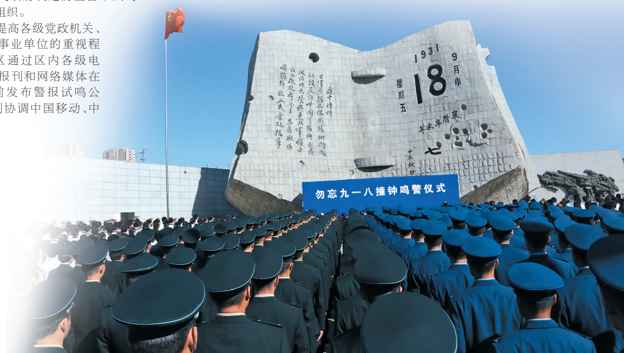
勿忘九一八撞钟鸣警仪式