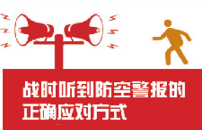
战时听到防空警报的正确应对方式

发挥广泛告知、人人皆知的国防教育作用。将人防活动作为开展国防教育的大好契机，利用多种媒体和平台开展宣传，增强“天下虽安，忘战必危”的危机意识，强化“居安思危、有备无患”的忧患意识，树立“天下兴亡、匹夫有责”的责任意识，牢固树立国防观念。