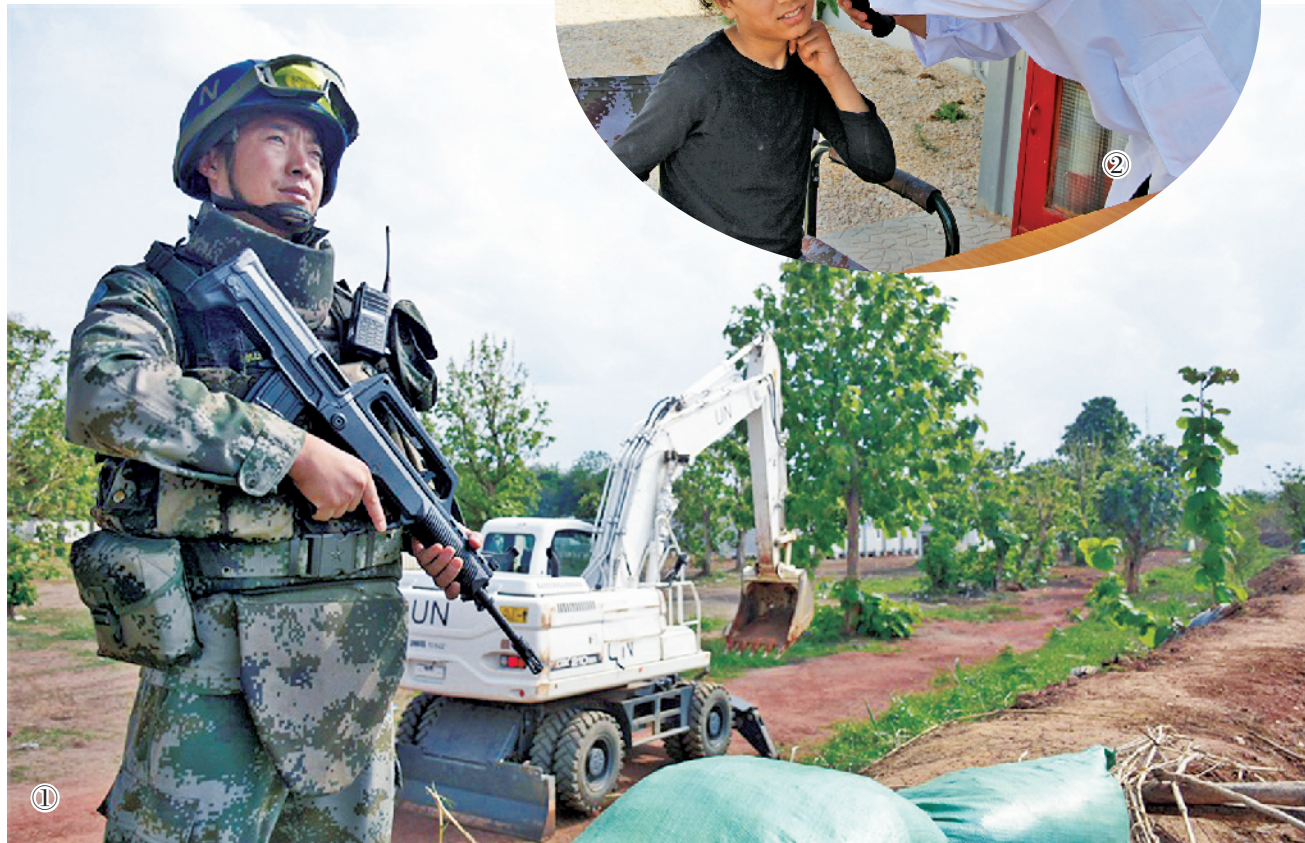
图①为中国维和官兵为孟加拉国工兵施工提供护卫。图②为中国第17批赴黎巴嫩维和部队多功能工兵分队在“中国医师节”开展义诊活动。

今年是联合国开展维和行动70周年,也是中国参与维和行动28周年。联合国新闻部与维和行动部、外勤支助部一起,使用联合国6种官方语言以及西班牙语、葡萄牙语制作了一系列图片、语音和视频。这批资料记录了中国维和官兵在利比亚、南苏丹、黎巴嫩等地执行任务的出色表现,各地民众还在画稿上用8种语言写着“谢谢中国,感谢您的服务和牺牲”,彰显中国作为负责任大国的国际担当。