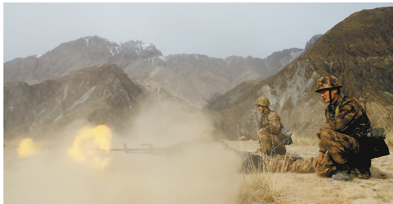
11月12日，新疆军区某边防团库尔干边防连在野外陌生地域进行重机枪实弹射击训练。训练中，他们严格按照实战化要求，设置逼真的战场环境，锤炼部队打赢能力。

6年来，拥军大院社区为优抚对象解决了千余件难题，先后获得“吉林省拥军服务先进社区”“长春市先进社区”“拥军优属先进单位”等诸多荣誉，被优抚对象誉为“最美拥军之家”。