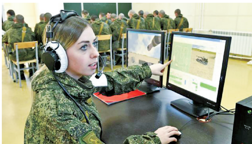
俄女兵在第631炮兵战斗使用训练中心参加训练