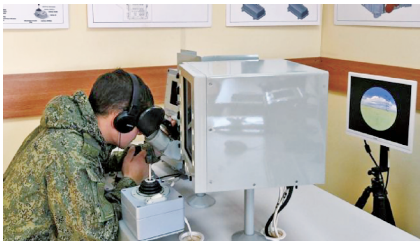
俄士兵在使用反坦克导弹操作员模拟器

据俄《消息报》报道，11月19日是俄罗斯火箭兵和炮兵节。俄陆军火箭兵和炮兵司令马特维耶夫斯基透露，2020年前，俄陆军至少70%的火炮将换装最新型号，包括向构建无人化炮兵系统迈出第一步的2S35“联盟-SV”自行火炮、“短号-D1”反坦克导弹系统。俄军还因为它们发明了新射击模式——“火力风暴”，即一门火炮用不同射角射出的多发炮弹同时命中目标。与此同时，为迎接新装备到来，俄火箭兵和炮兵部队在人才培养方面采取多项措施。