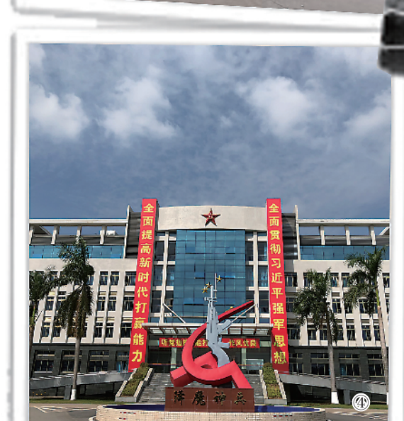
图①:上世纪80年代,官兵在营房前搬物资。李志国供图 图②:上世纪90年代,官兵在宿舍前拔河。马红明供图 图③:上世纪90年代末,官兵搬进三层小楼。李亚旗摄 图④:进入新世纪,该旅新建办公大楼。黄伟毅摄 图⑤:进入新世纪,现代化营房拔地而起。黄伟毅摄