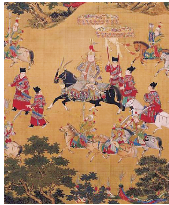
《出警入蹕图》局部,画中红衣黑帽者即为锦衣卫