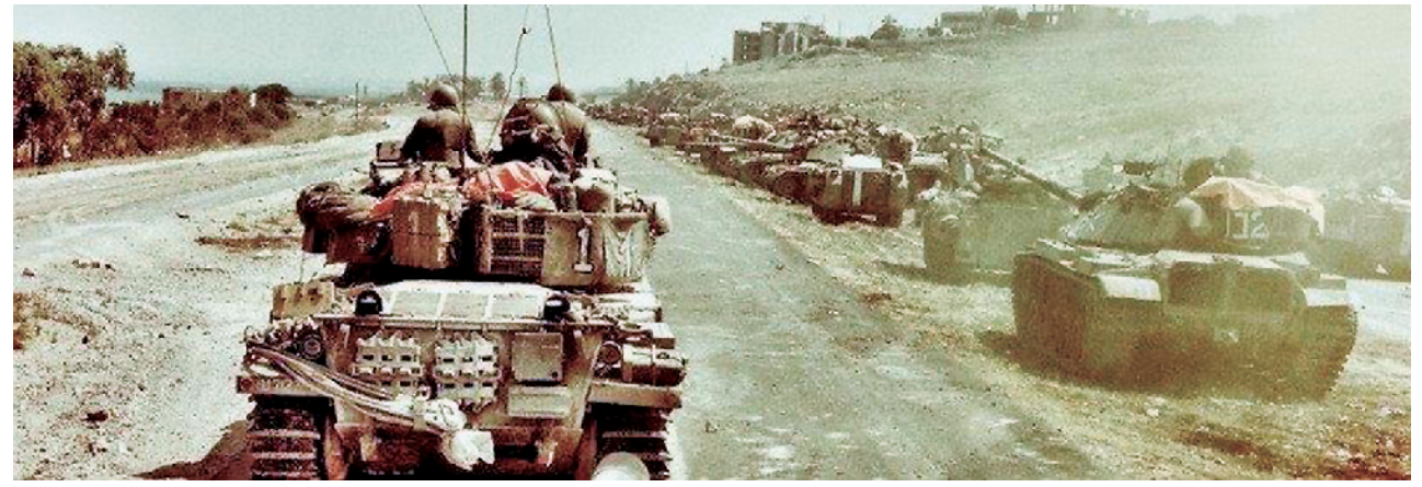
1982年的“黎巴嫩战争”中,以军总参谋部发挥重要作用