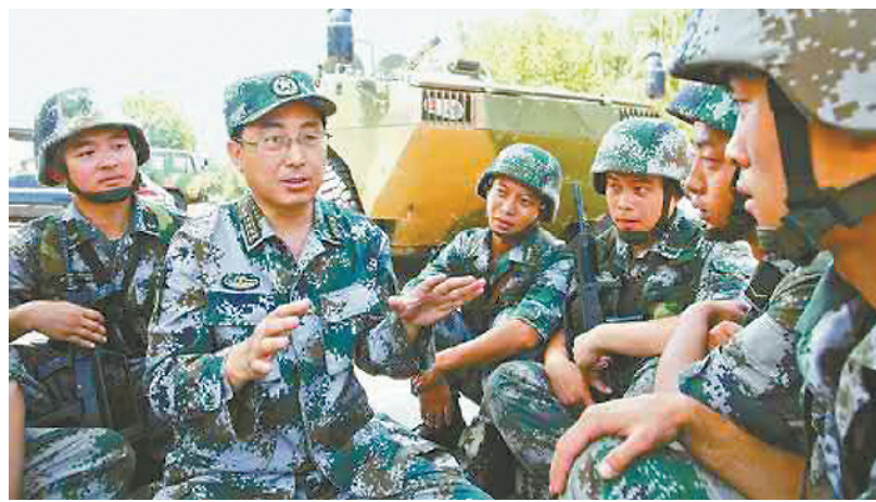
韦昌进(左二)给官兵讲述战斗故事

“永远做一枚出膛的炮弹，组织指到哪儿我就打到哪儿，不断发出光和热。”走出战场后，韦昌进被中央军委授予“战斗英雄”荣誉称号，被人们誉为“活着的王成”，先后参加全国巡回演讲、国务院群英盛会，受到国家领导人接见……但是，韦昌进没有沉浸在鲜花和掌声当中，而是牢记自己对组织的承诺，在每一个任职岗位上都留下扎实的奋斗足迹。