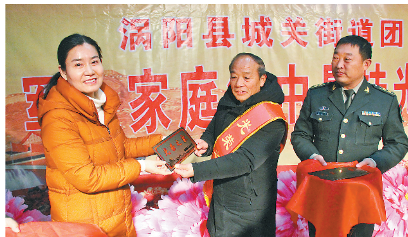
1月12日,安徽省涇阳县城关街道团社区启动军人家庭集中悬挂光荣牌仪式。连日来,该县城乡各地开展发一封慰问信、一份慰问品等“六个一”活动,掀起尊崇军人热潮。

记者了解到,此次轮训采取“民兵教练员先训,骨干民兵后训,教练员自主组训,轮训办公室考评指导”的模式进行,在总结去年组训经验的基础上对今年训练内容进行优化调整,探索建立体现时代特色、满足实战需要、适应甘南州发展实际的骨干民兵集中轮训与常态化备勤新模式,计划分13个批次对包括共同基础、专业训练及任务行动3大类的35个课题,全州8县(市)的教练员、骨干民兵、州民兵应急营、专业救援分队以及民兵情报信息员共计1000余名全部轮训一遍。