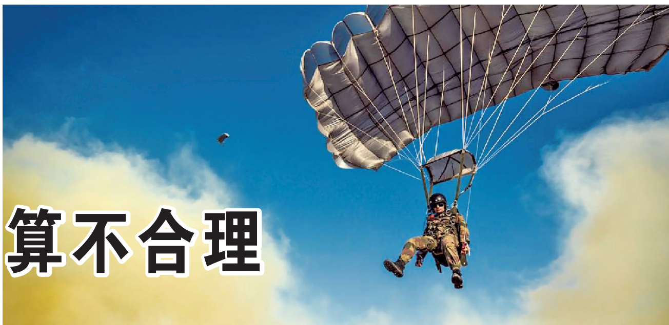
印军士兵参加演习

鉴于纯军事路线行不通,为应对所谓伊朗威胁,特朗普政府更多是在多领域联合发力进行“极限施压”。经济上,持续加大制裁力度;外交上,在诱压俄、欧、土等配合制裁效果不佳情况下,重点推进与沙特、埃及等8个阿拉伯国家建立“阿拉伯版北约”,同时谋划2月与波兰共同举办中东问题国际会议继续对伊施压;舆论上,让博尔顿等鹰派持续抛头露面加强对伊朗的宣传攻势,使其在国际上面临更大压力;军事上,则反复玩弄“狼来了”把戏制造大兵压境声势,试图让伊朗签订城下之盟。对于美国来说,随着时局发展,会继续调整上述手段的具体内容与组合运用,表面上是为阻止伊朗获得核武器,实则是为打压反美势力,维护美国全球霸权。