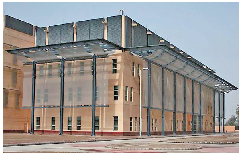
美国驻巴格达大使馆面积比联合国纽约总部大6倍,工作人员多达1.5万人

美国“全球研究”网站在《戴着“人面具”的恐怖主义》一文中承认,包括驻巴格达大使馆在内的美国驻伊使领馆,事实上都曾充当中情局在中东秘密活动的落脚点或指挥中心。比如,伊拉克权力交接后出任美国首任驻伊大使的内格罗蓬特,另一个身份就是中情局驻伊拉克暗杀小组的发起者,负责在美国大使馆内坐镇指挥。