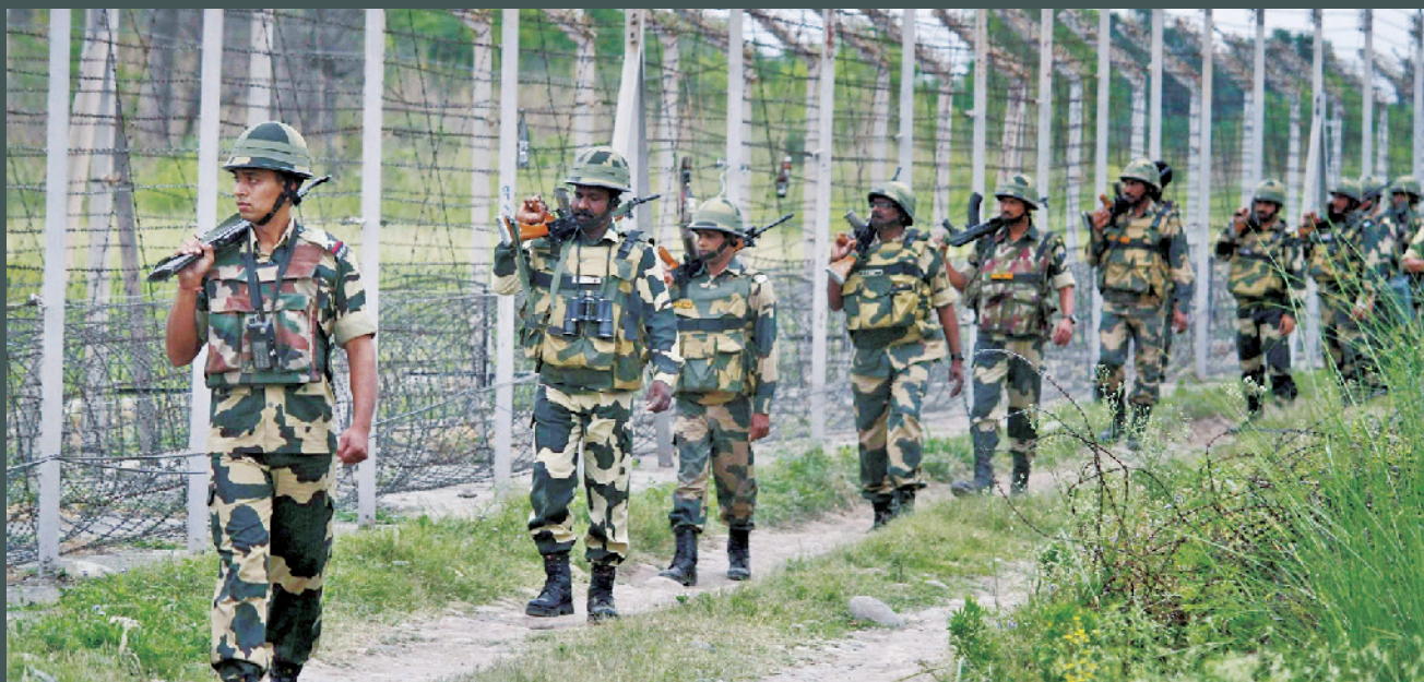
印度军人在边境巡逻

据印度“国防咨询”网站近期报道,2019年,印度各军种都将面临“军官荒”难题。报道称,作为世界第二人口大国,印度从来不用担心兵员问题,但高素质军官严重短缺,已成为制约印度军队发展的瓶颈。为此,印军采取了诸多保留和选拔军官的举措,但效果并不明显,雪上加霜的是,印军提前退役或退休军官人数还在逐年增加。