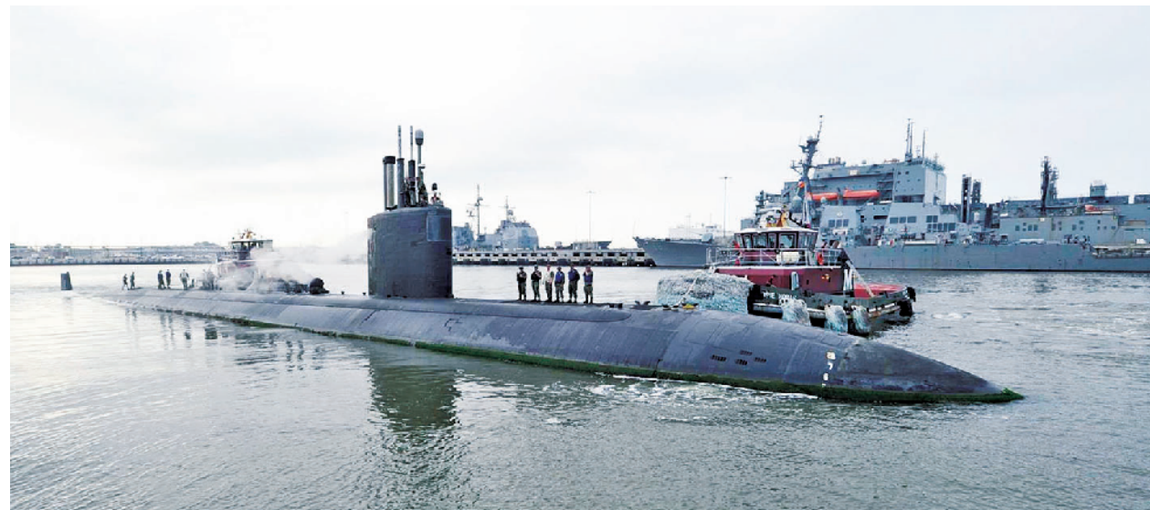
“博伊斯”号即将进厂维护

虽然增加军费,但似乎没有那么容易实现自主国防。根据美韩达成的联合部队在战时作战指挥权移交后遵循的原则,美国支持韩国扩大自身国防责任、遇外来侵略,并答应填补韩国军事能力上的不足。但双方谈不拢的就是钱。特朗普数次放话要韩国增加“保护费”,即在现有分摊费用的基础上上涨1倍。韩国现在每年承担8.3亿美元,特朗普要求增至16亿美元,韩国上下都不买账。2018年12月31日是上一个协议的到期日,不过到现在双方都没有谈妥新的协议。如果不交钱,无论是指挥权移交还是自主国防建设,韩国都可能面临美国的刁难。迫不得已,韩国很可能还得每年多拿出十几亿美元,去填补特朗普的胃口。