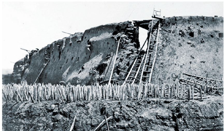
城墙前密集树立的木制防御工事即为鹿角,亦称鹿砦