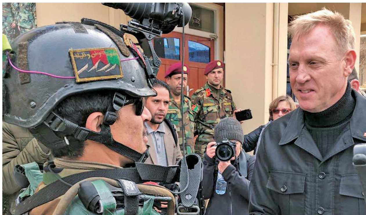
美国代理防长沙纳汉与一名阿富汗军官会面

另外，极端组织“伊斯兰国”在阿富汗也有卷土重来之势。据多方估算，目前在阿境内有3500至10000名“伊斯兰国”武装分子，不断在各地实施恐怖行动，阿富汗国民军和安全部队不得不在全国进行联合反恐行动。