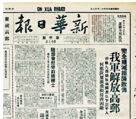
《新华日报》对高邮战役的报道