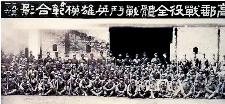
高邮战役全体战斗英雄模范合影

1945年8月15日，日本政府宣布无条件投降，华中敌占区大部相继被收复。但国民党集团企图抢夺胜利果实，勾结伪军盘踞在江苏高邮、邵伯一带，伪军拒绝向新四军投降。12月19日至26日，我华中野战军集中15个团兵力，向驻高邮日伪军发起全面进攻，一举拔除残存日伪据点，歼灭日军1100余人、伪军5000余人，创造我军一次战役歼灭日军人数量最多的纪录，被史学界称为抗日战争最后一役。