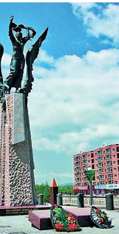
“友谊和和平天使”纪念碑