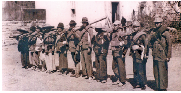
东江纵队突击队队员