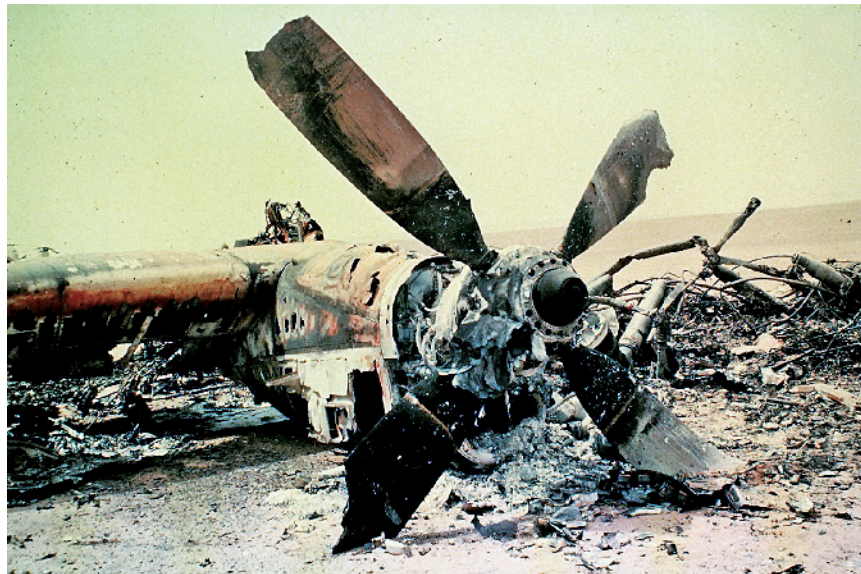
美军遗留在伊朗沙漠中的飞机残骸

此时，缺少预案的弊端进一步放大。行动取消后，所有人员在撤退时才发现，整个计划并没有直接从沙漠撤离的预案，参加行动的美军各个单位也从未演练过相关内容，这给美军带来灾难性打击。撤退命令下达时，美军出现混乱，一架直升机撞向正准备起飞的C-