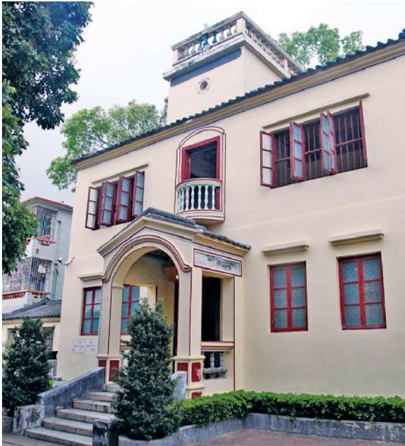
东江纵队指挥部旧址

“撅把子”虽然质量一般，却适应敌后抗日斗争。由于体积小，经常身着便装的敌后武工队，可轻松将“撅把子”藏在身上。由于外形有别于制式枪械，曾有抗日民兵将被搜出来的“撅把子”称为木匠工具，骗过日军新兵顺利脱身。很多地方抗日武装，正是使用“撅把子”打击敌人，缴获武器，进而发展壮大。（杨壹铭）