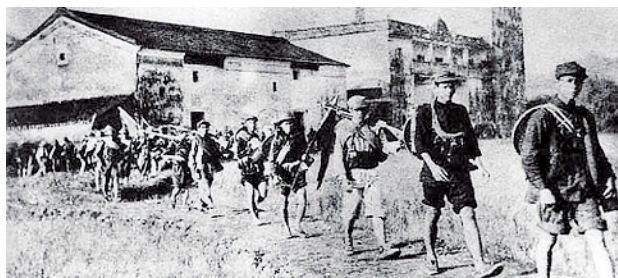
行军途中的东江纵队