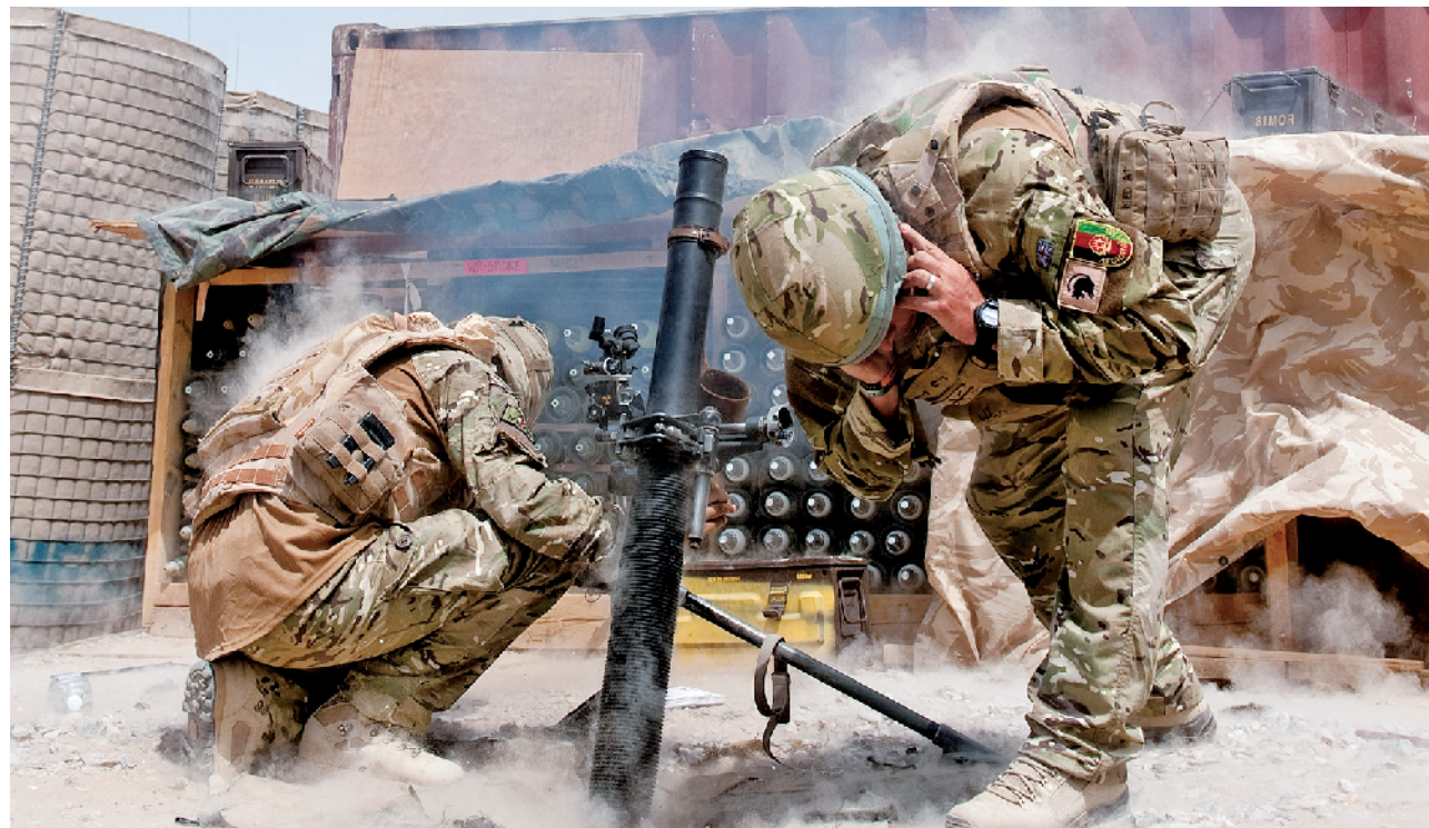
英国陆军士兵在阿富汗使用81毫米迫击炮向武装分子开火

官兵士气低落。根据英军统计数据，约35%现役官兵对部队生活总体满意，7%自认工作状态较好，而希望在服役期内提前退役的比例为26%，在本阶段任职期结束后立即退役的比例为25%。最令人担忧的是，仅40%的陆军官兵愿意推荐他人参军。