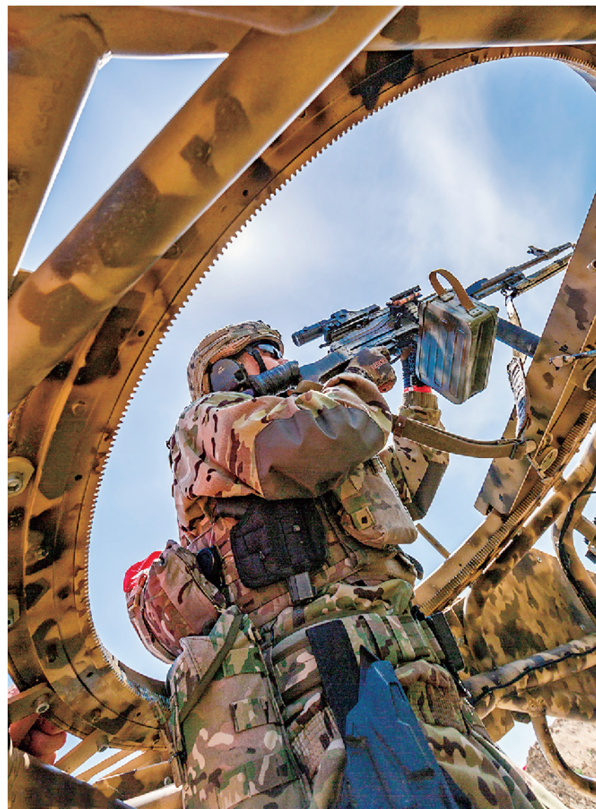
俄军特战队员进行小组战术训练