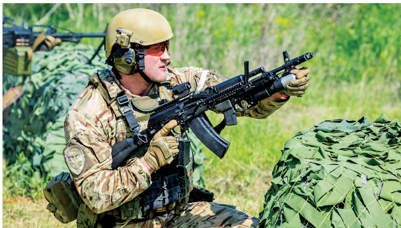
俄军特战队员进行射击训练