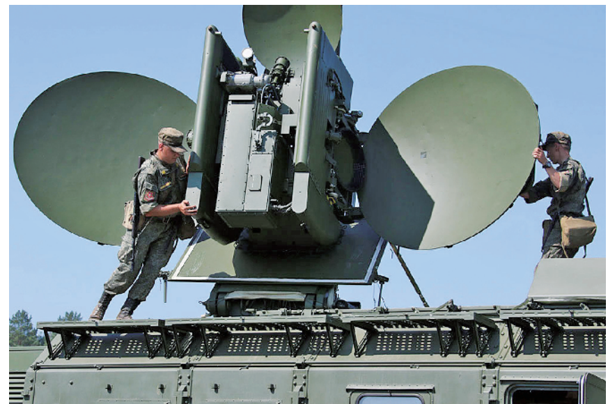
俄军“克拉苏哈-4”电子战系统

俄军事专家维克托·穆拉霍夫斯基指出，俄军驻北极地区电子战分队可遂行多样化任务，主要体现在两个方面：一是保障北方海航道航海安全；二是控制该地区的电子环境。他指出，最近几年，除导航、水文地理和救援保障外，北极地区的军事安全也受到多方关注。俄军已在这些方向开设机场，目前正在修建空中、水面和水下环境照明系统，以实现对该地区的全覆盖。电子战是这一工作不可分割的组成部分。可以预见，随着北方海航道的重要作用越来越凸显，俄罗斯在该地的军事部署也将随之加强。