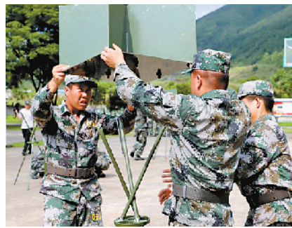
上图为民兵进行角反射器架设和撤收训练。

本报讯 王泉良报道：“敌”侦察卫星即将过顶，民兵按照预定方案迅速对阵地进行迷彩伪装的同时，设置角反射器，制造假目标，释放阻塞气球干扰“敌”侦察，整个过程行云流水、一气呵成。这是5月31日，广西钟山县对口保障军兵种民兵分队在火箭军某部班长骨干指挥下练兵的场景。