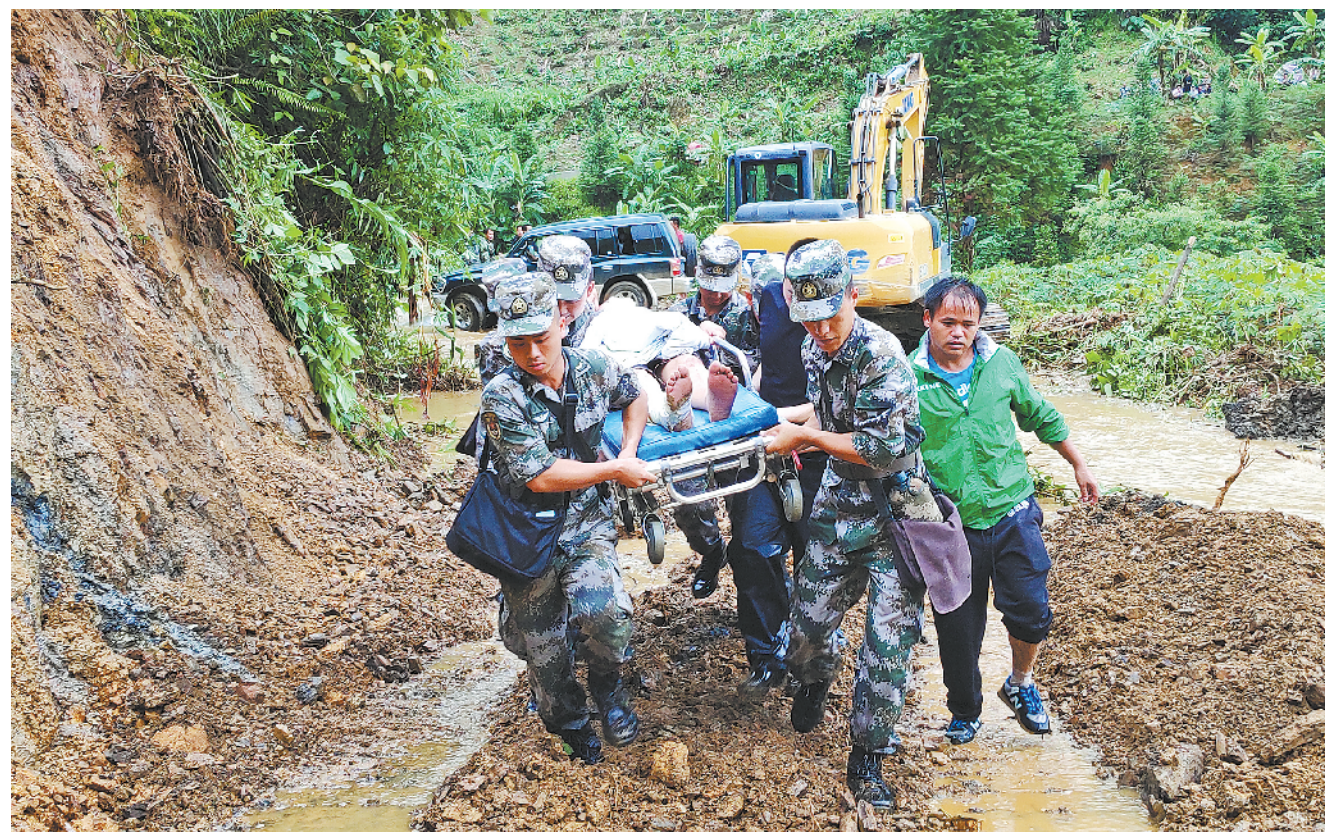
由于连续多日的强降雨,6月24日凌晨,云南省红河州金平县金水河镇南村村委会联防村遭受特大泥石流灾害。南部战区陆军某边防旅立即启动应急预案,官兵携带救援物资器材火速赶赴现场,搜救转移受灾群众。图为官兵冒着山石滚落的危险,将重伤群众送至转运点。