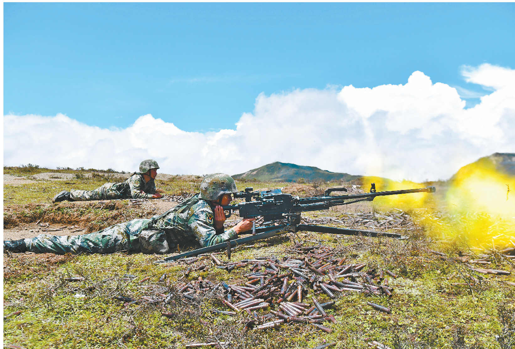
七月二十九日，西藏山南军分区边防某团组织官兵在海拔四千五百米的野外驻训场展开综合战斗训练，通过武装奔袭、实弹射击等课目，有效锤炼官兵作战能力。

转眼20年过去了，大山还是那片大山，我却从“小马”变成了“老马”。荣幸的是，这20年我一直从事武装工作，亲历了基层武装部和民兵组织建设的发展变化，而能够一直为武装工作出点力，我的心里满是幸福感！