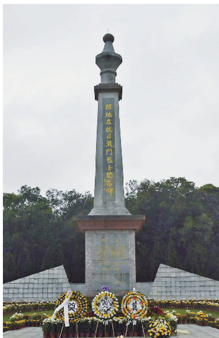
植地庄抗日战斗烈士纪念碑