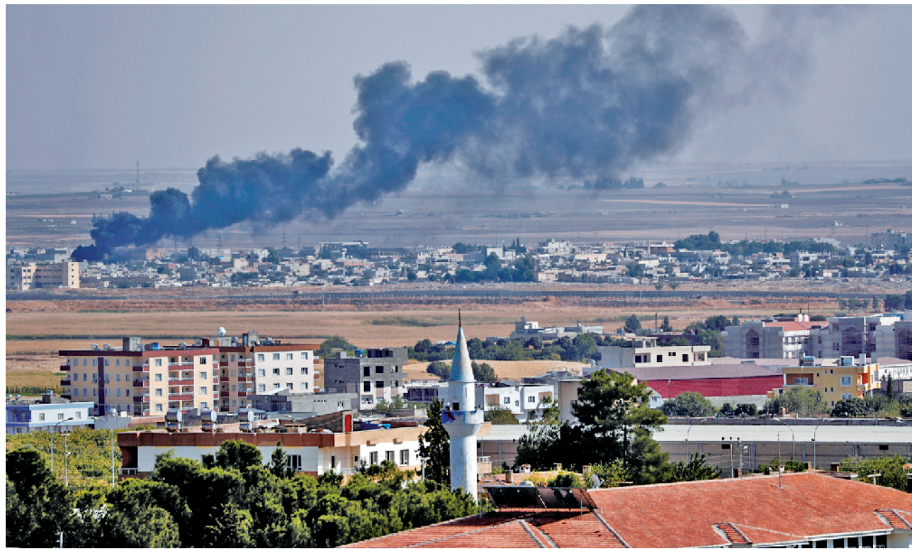
10月13日,遭到土军炮击的叙利亚边境城市拉斯艾因

临“人道主义灾难风险”。据联合国11日发布的报告,自土耳其对库尔德武装展开军事打击以来,遇袭地区已有10万人逃离家园。库尔德族控制区当局12日则表示,流离失所的人已经接近20万。