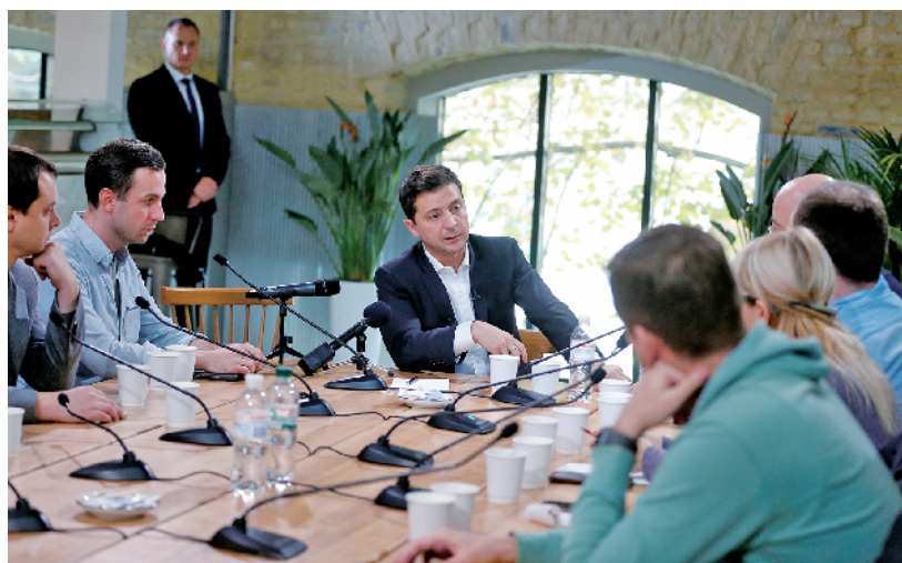
乌克兰总统泽连斯基表示,将在“诺曼底模式”四国峰会上讨论俄乌下一批被扣押人员交换事宜

分析人士指出,乌克兰要解决乌克兰东部冲突问题,一靠军事力量,二是和平谈判。第一条路显然走不通,乌自身实力难以抗衡俄罗斯,“拥美自重”也无法保证百分之百安全,解决东部冲突问题最终要回到外交途径解决。普京坐到“诺曼底模式”四国峰会桌前表明俄有谈判的意愿,完成首批被扣押人员交换意味着磋商有进展。正因如此,泽连斯基才顶住国内压力,奉行与俄接触政策,甚至声称未来不排除与普京举行双边会晤的可能性。但也要看到,“诺曼底模式”要想取得突破,各方需要做出更多积极的努力,乌克兰东部地区的和平之路注定不会平坦,一旦超出范围涉及其他地区和其他问题,俄罗斯很难让步。