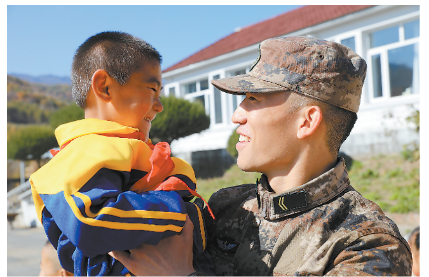
10月下旬，北部战区陆军某舟桥团官兵代表来到了辽宁省宽甸县山村小学，为学生们上了一堂生动的国防教育课。课后，小学生向官兵表达：“长大后，我也要当解放军。”

学员培训结束后，进行结业考核，根据不同的专业发放培训合格证书、职业资格证书、精准培训证书、上岗证等，推荐到当地龙头企业工作，并协调市人才资源与就业服务中心定期召开专场招聘会，确保参加培训的退役军人及家属实现合格结业、上岗就业。