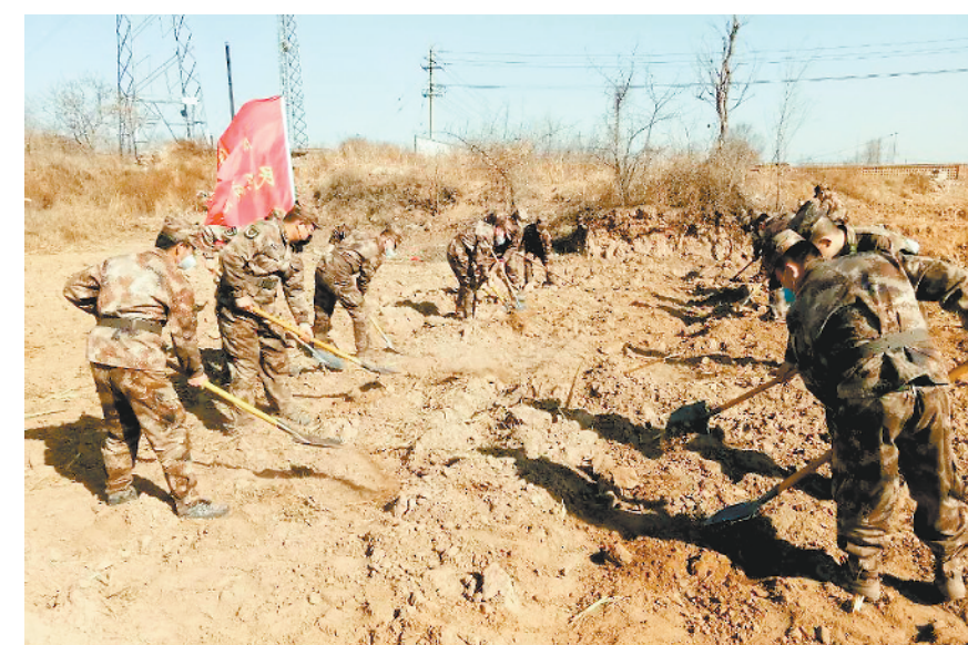
3月6日，山西省原平市人武部响应市委市政府支持春耕号召，出动民兵积极帮助农民平地挖渠，为春耕播种打基础。

新冠肺炎疫情出现后，如何在较短时间内整合力量、全力支援地方抗击疫情，这是很大的挑战；在疫情形势趋缓后，如何统筹好疫情防控和部队各项工作，也是很大的挑战。适应“两个战场”甚至多维战场同时作战，需要军队各级组织把握特点规律，区分疫情风险等级，差异化组织部队训练，全程督导各项防控要求落实；各级领导干部身先士卒、担当作为，科学调训训练场地、时间和人员，探索创新疫情期间教学组训方式方法，注重运用信息化、智能化等手段开展教学训练活动；广大基层官兵始终保持高昂士气和顽强作风，保持疫情防控常态化，真正做到疫情防控和练兵备战“两手抓、两不误”。