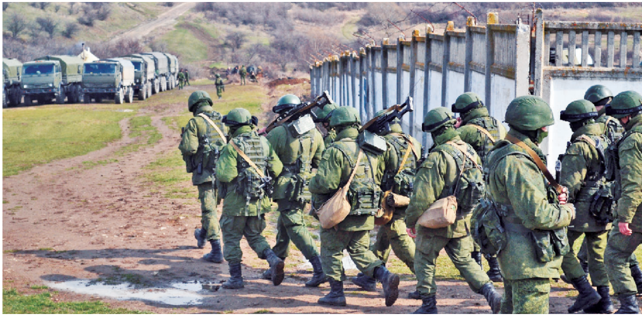
进入克里米亚军事基地的俄军

2014年2月24日至3月21日,俄罗斯运用多种手段一举收回克里米亚,令北约大为震惊。俄首先开动宣传机器调动当地俄罗斯族人亲俄情绪,而后特种部队伪装登陆,大部队随后跟进,情报人员关键时刻扰乱乌军指挥系统,俄军进而夺取各要地。紧接着,俄在几天内组织克里米亚公投,根据投票结果宣布克里米亚入俄。俄罗斯将源于西方的“混合战争”理论用于实践,收回克里米亚,成为应用该理论的典型战例。