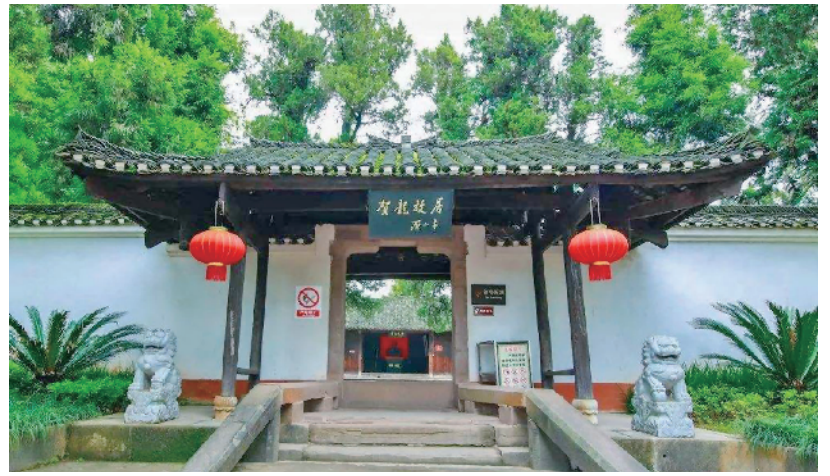
桑植是贺龙故乡,图为贺龙故居

把握战的分寸。 需要强调的是,虽然利战思想在战争中运用比较普遍,但在军事行动中仍属一种“奇”计,受限条件较多,必须以敌方主帅“愚而不知变”“贪利而不知害”为基础,且在对方不明我企图,被我“利诱”的战争态势下才适用。在现代战争条件下,各种侦察设备几乎覆盖战场的整个空间和各个角落,战场“透明度”大大提高,军队部署和行动随时处于监控之中,想完全隐蔽己方企图,通过“利诱”充分调动敌人非常困难。因此,对于利战,我们一定要掌握火候和分寸,不可过分依赖和强调利战。指挥员在作战开始前,也应考虑敌未“上钩”时可能出现的情况,针对性制定预案,防止诱敌未成,陷入手足无措甚至被“反咬一口”的不利境地。