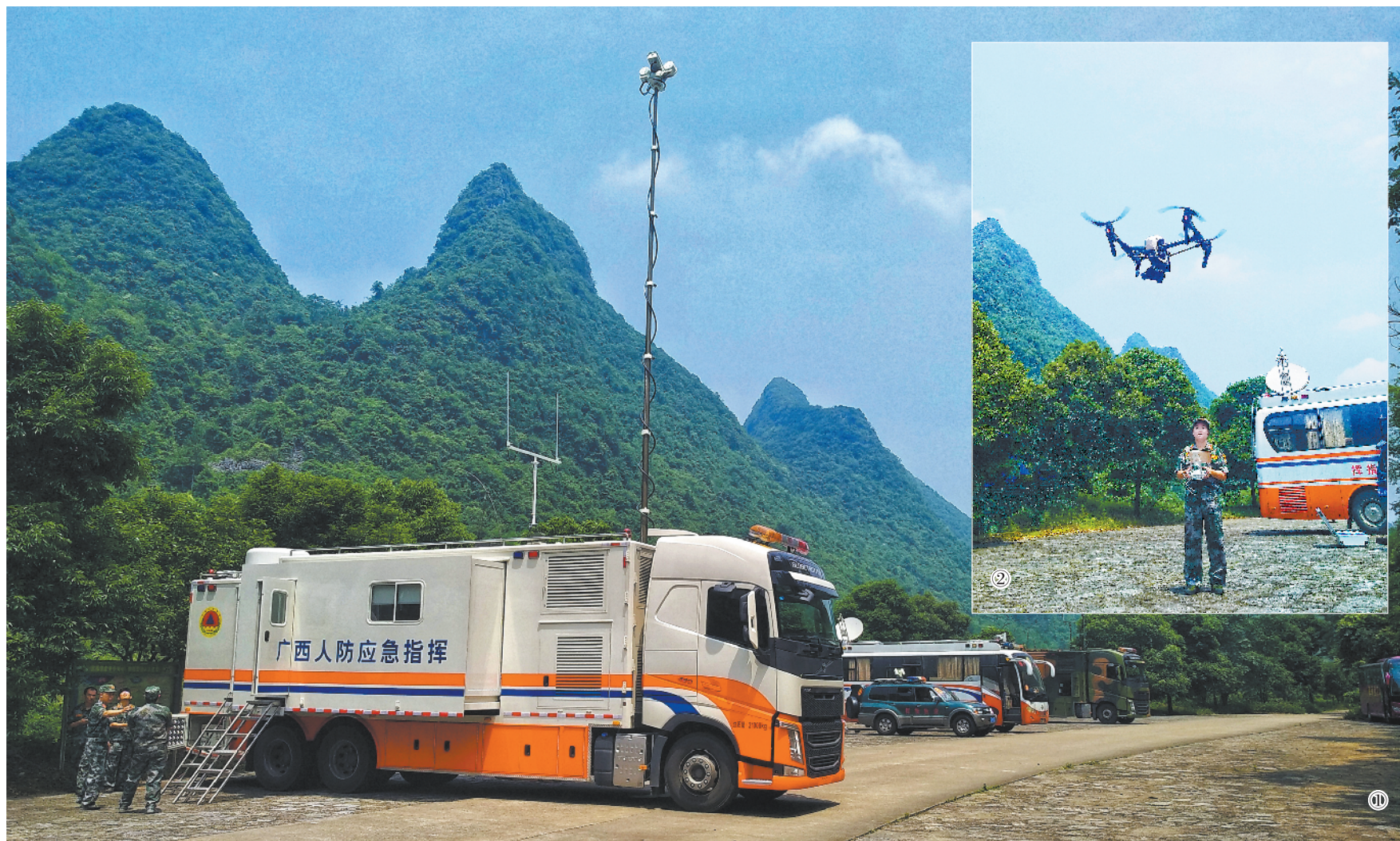
5月中下旬，广西南宁市、桂林市人防办依托新型指挥通信器材，联合开展通信分队野外训练，着力提高协同保障能力。图①：两支通信分队在桂林市永福县罗锦镇进行互联互通；图②：桂林人防通信保障人员运用无人机采集、报送现场信息。