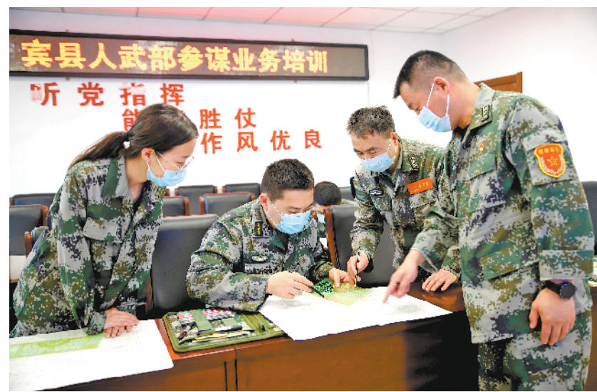
5月下旬，黑龙江省宾县人武部开设军事课堂，组织现役和文职人员学指挥、学军事技能，全面提升人员遂行多样化军事任务的能力。

光有信任还不够，最终还得靠真本事赢得信任与地位。岗位变动，并不意味着责任和能力的会跟着一道升级。足智多谋、能参善谋，是参谋立身行事的底气和资本。士官参谋应尽快对自身业务熟悉起来，在务谋、思谋、练谋、用谋上下一番苦功夫，尽早发挥出辅助决策、指挥协调的作用，摘掉“板凳队员”的帽子，扛起打赢重担，制胜未来战场。