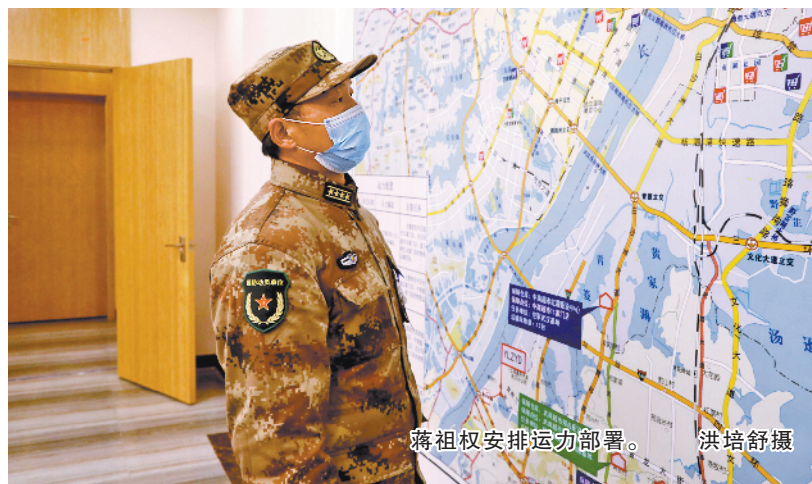
蒋祖权安排运动部署。