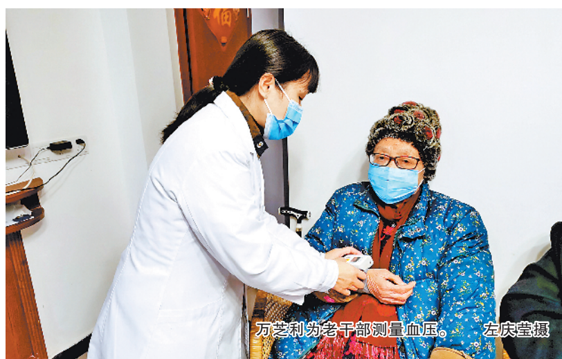
万芝利为老干部测量血压。