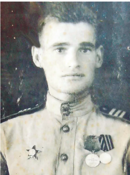
阿列克谢·斯库拉托夫年轻时的照片