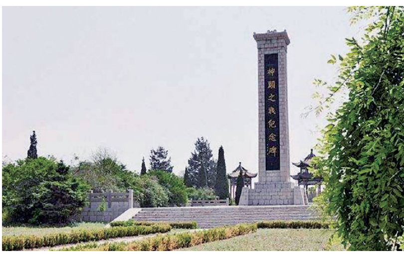
徐向前元帅题写的“神头之战纪念碑”