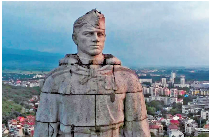
阿廖沙纪念碑近景