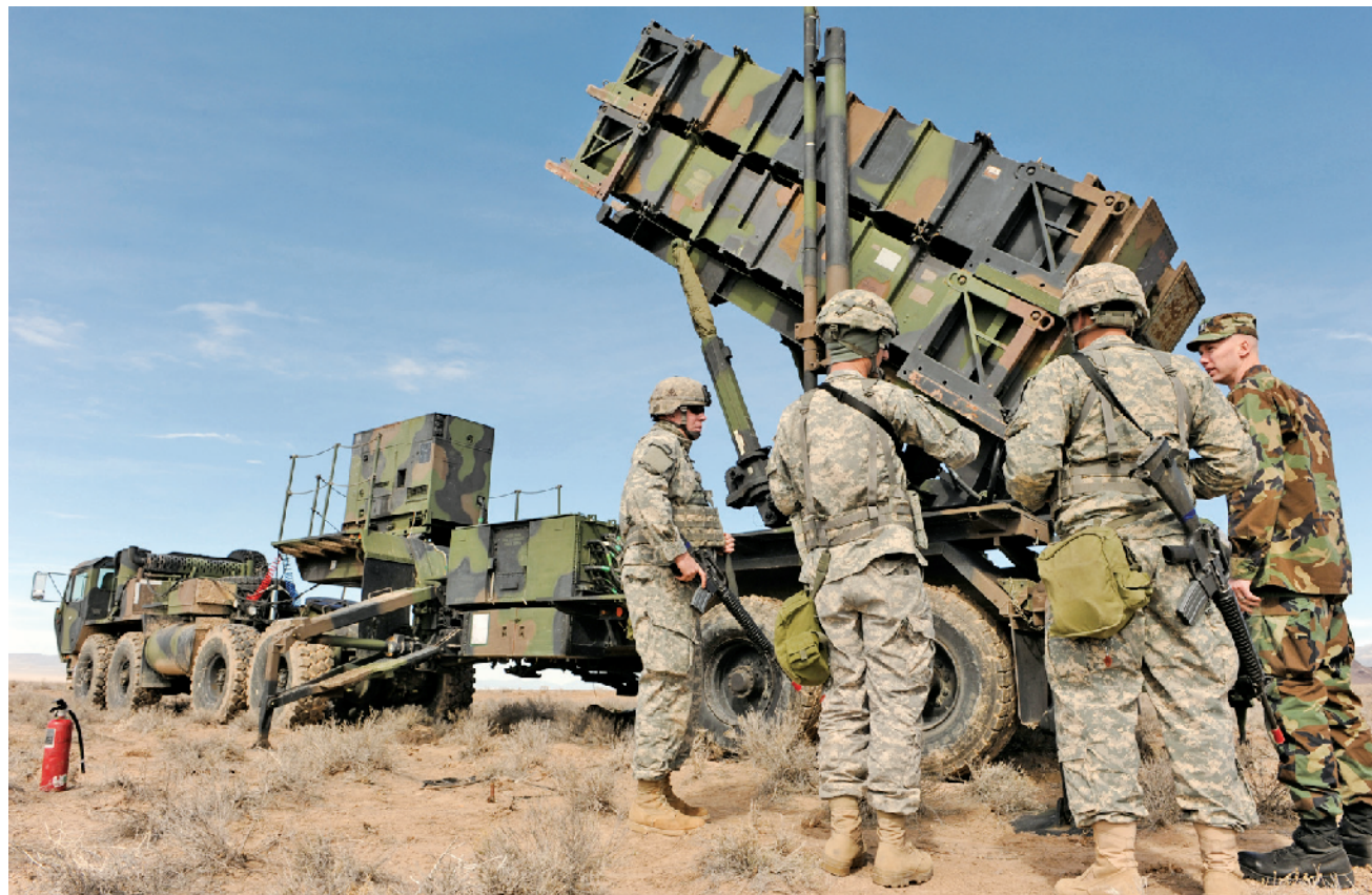
美国“爱国者”防空系统