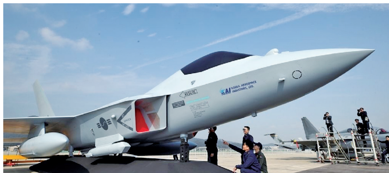
韩国自主研发的KF-X战机