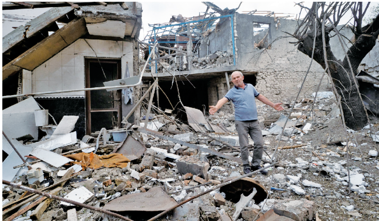
一名男子站在纳卡地区的一处建筑废墟上

阿塞拜疆国防部随后反指亚美尼亚军队在前线发起攻势,并用火炮攻击人口密集地区,“公然违反”停火协议。阿塞拜疆总统助理在社交媒体上称,阿塞拜疆第二大城市占贾10日深夜遭遇来自亚美尼亚的导弹袭击,造成7名平民死亡,33名平民重伤,死伤者中包括妇女和儿童。阿塞拜疆国防部发表声明称,亚美尼亚军队在10日12时停火协议生效后,对泰尔泰尔和阿格达姆地区发动进攻,很多居民点遭到炮击,此举严重违反在莫斯科达成的停火协议,阿塞拜疆将采取适当报复性措施。