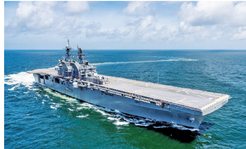
美国级“黎波里”号两栖攻击舰进行海试

上个月,美国防部频频造势,表示要将美海军舰艇数量增至500艘左右。在原本“355艘舰艇”计划尚未完成的情况下,再将舰艇规模扩大到500艘左右,扩舰计划或成一纸空谈。