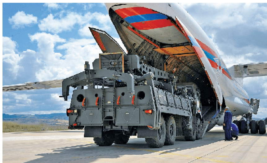
S-400防空导弹系统运抵土耳其穆尔特德空军基地

美国“防务一号”网站报道称,土耳其已激活俄罗斯制造的S-400防空导弹系统,并专门用于追踪从多边形演习中返回的希腊空军F-16战机。随着土希关系不断紧张,土耳其此举被视作是对希腊近期动作的回应。此外,S-400防空导弹系统一直是美土关系恶化的主要因素,背后折射出的美土博弈恐将愈演愈烈。