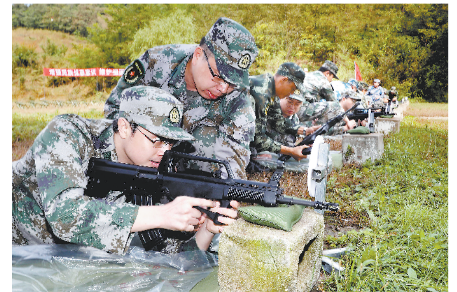
9月29日，辽宁省抚顺军分区组织市党政机关干部和编兵单位领导过军事日。通过参观武警抚顺支队机动一中队、观看军事课目展示、实弹射击等活动，体验军营生活，接受国防教育。

据了解，该大站义诊小分队成立以来，在地巫乡义诊40余次，诊断病患500余人次，成功救治百余名患者，受到当地藏族群众好评。