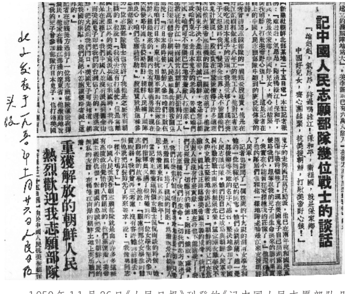
1950年11月26日《人民日报》刊登的《记中国人民志愿部队几位战士的谈话》