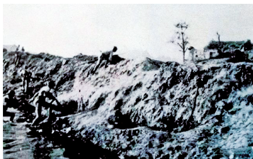
济南战役中，109团打开通往商埠的突破口

指挥灵活多变，突击勇猛顽强。战斗过程中，109团各级指挥员根据上级意图灵活指挥，及时组织部队勇猛突击、大胆穿插、迂回包围，打乱敌部署，扩大战果。23日晚，该团在夺取外城后，不顾疲劳和减员，继续强攻内城。24日拂晓，该团在登上城头时，遭数倍之敌连续反扑。全团临危不乱，与敌展开白刃格斗，与敌反复争夺突破口达4小时之久，最终击退敌人，为后续部队投入战斗创造有利条件。同时，各营连指挥员也能够机智处置情况，坚决果断组织部队歼敌。攻打外城时，4连在登城后与后续部队失联，6连不等上级指令果断登城接替战斗。强攻内城时，7连连级干部全部伤亡，排长挺身而出，带领全连迅速登城。3连、9连率先突入内城后，得知突破口被敌封锁，当机立断，克服自身不利处境回援突破口战斗，从侧后给敌以突然打击，有力配合主力部