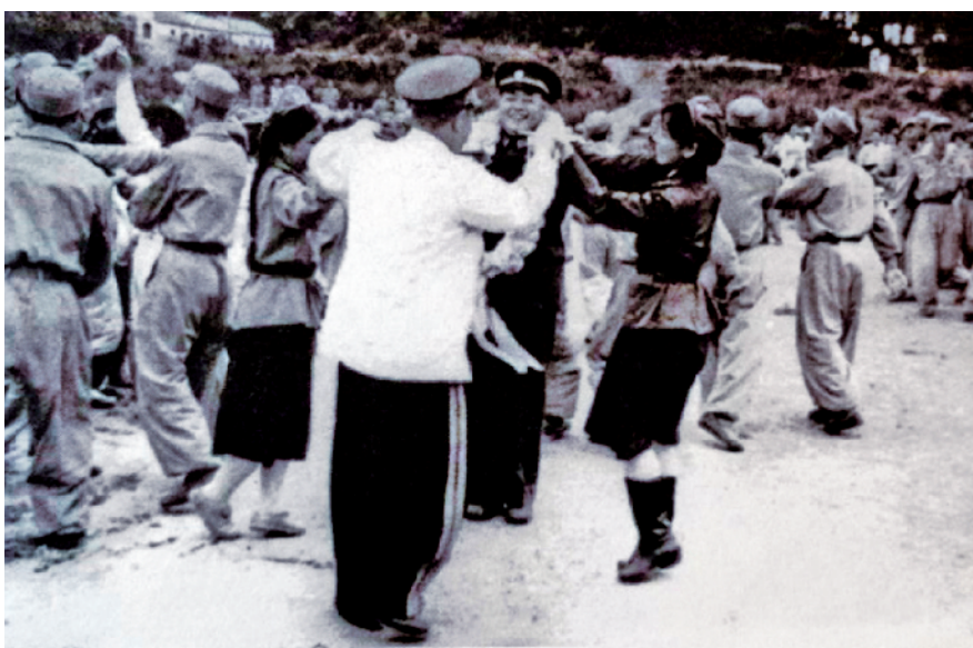
志愿军与朝鲜人民军联欢