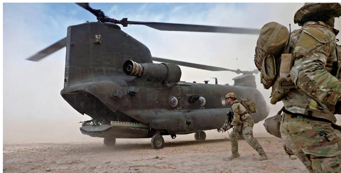
澳大利亚特种部队

去年4月,美国断然拒绝国际刑事法庭就阿富汗战争中联军存在的罪行调查申请,称此举威胁美国主权和国家利益,并拒绝同国际刑事法庭合作。去年11月,英国广播公司曝出英国军方在阿富汗犯下杀害平民和对平民用刑等战争罪行,但英军方选择无视和隐瞒。这些行为严重伤害阿富汗人民感情,不利于地区的和平稳定。