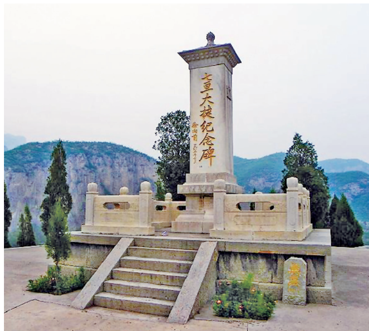
山西省阳泉市平定县七亘村的七亘大捷纪念碑