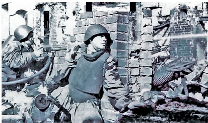
斯大林格勒保卫战中的苏军士兵

激发将士死战的斗志。“受战”就是被迫接受作战，处于被动本身不可怕，可怕的是在被动中丧失信心。战争实践经验证明，被敌包围时，军心士气是决定战争胜负的重要因素。身处绝境，只有上下一心，燃起同仇敌忾、奋力死战的斗志，才能于绝境中闯出一条生路。首先，要军民一致，将士一心，受围后敌必想尽一切办法动摇和涣散我方士气，此时，主帅要让将士明白唯有拼死一战才有出路。斯大林格勒保卫战中，苏军和斯大林格勒市民表现出“一步也不后退”的大无畏精神，使纳粹德军在苏联战场上处处碰壁，加速了其覆灭。其次，主要要作好表率，冲锋在前。斯大林格勒保卫战中，德军主将鲍罗索的司令部设在距前线150公里外的小镇别墅，而苏军主将崔可夫的司令部距前线仅400米，但他誓言，决不会渡河撤退。第三，内部要团结一致，相互支援，在反攻作战阶段，苏军仓库和野战医院均紧随部队推进，进行有效保障，各方面军和集团军相互支援，形成了共同抗敌的合力。