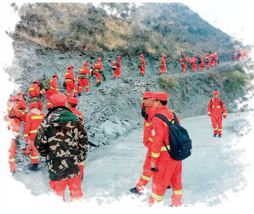
2019年3月31日,27名消防队员和3名地方干部群众,牺牲在扑救四川省凉山州木里县森林大火的战斗中。

危害自古就有,这是一个古老的国家安全问题,是传统安全问题,但把生物安全纳入国家安全体系,则是对国家安全的新认识,是一种非传统安全观。”刘跃进说。在军事、政治、领土为传统的国家安全观中,疫情灾害不是国家安全事件,防疫卫生和医疗救治不是保卫国家安全,但在“以人民安全为宗旨”的总体国家安全观视野中,新冠肺炎病毒对人民生命安全的威胁和危害,就是对国家安全的威胁和危害。抗