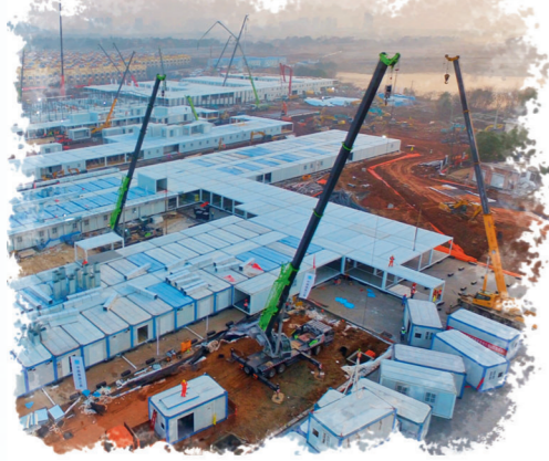
2020年2月2日,武汉神山医院正式交付,从方案设计到建成交付仅用时10天。

过去,我国公民在国内,保护国民在本土安全,是国家安全工作的重要职责。现在,伴随大量国民出国出境,海外国民安全就成为国家安全的新内容。刘跃进认为,海外安全包括海外利益安全和海外国民安全,这是从国内国外的角度对国家安全进行新的划分形成的两个概念。海外安全对应的是国内安全或海内安全,而不是国民安全、国土安全、政治安全,等等。