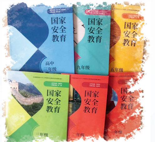
正在中小学校推广使用的国家安全教育丛书。

国家安全活动已经成为一个比其他任何时代都更加复杂化的复杂社会系统工程。“大的安全是国家安全,小的安全也是国家安全。”刘跃进解释说,从范围和边界来看,国家安全是一个国家所有领域、所有方面、所有层级安全的总和。传统安全观和传统安全思维关注的安全,如政治安全、军事安全、国土安全、主权安全等,属于国家安全;总体国家安全观揭示出来的安全,如文