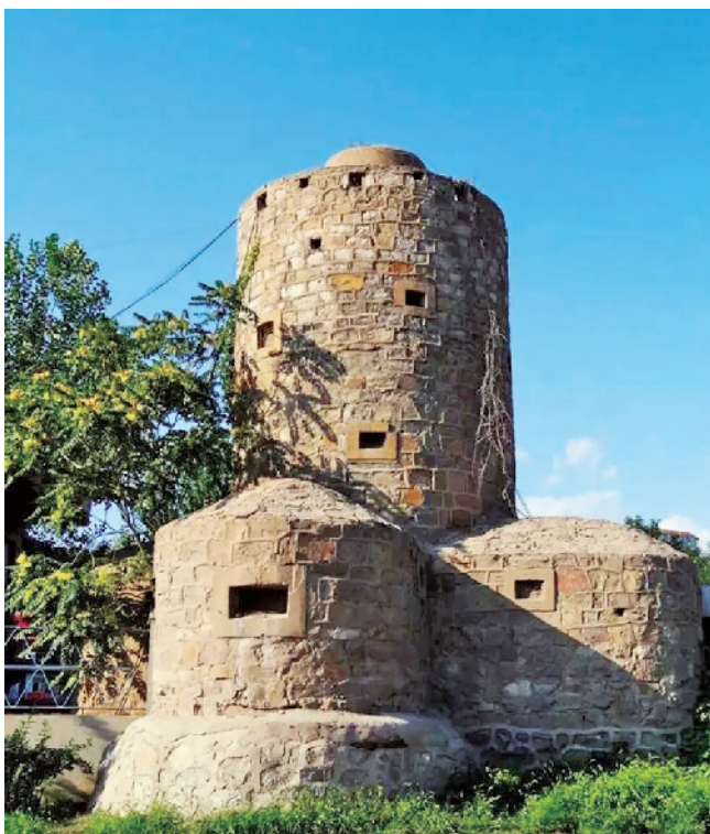
卧虎山脚下的梅花碉

人反应过来再去强攻，势必造成更大伤亡，此时正是攻下卧虎山的最佳时机。师部领导当机立断，发布全师投入战斗的命令。