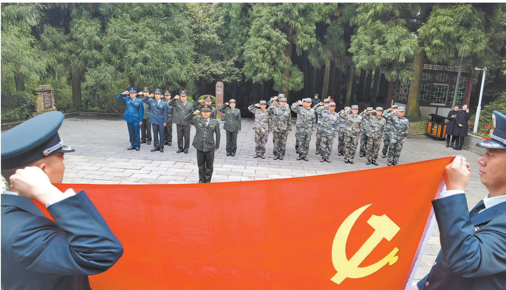
4月27日，贵州省贵阳市云岩区人武部、花溪区人武部组织官兵和文职人员赴遵义会议旧址和娄山关战斗遗址开展党史学习教育。图为区人武部党员在娄山关红军战斗纪念碑前重温入党誓词。