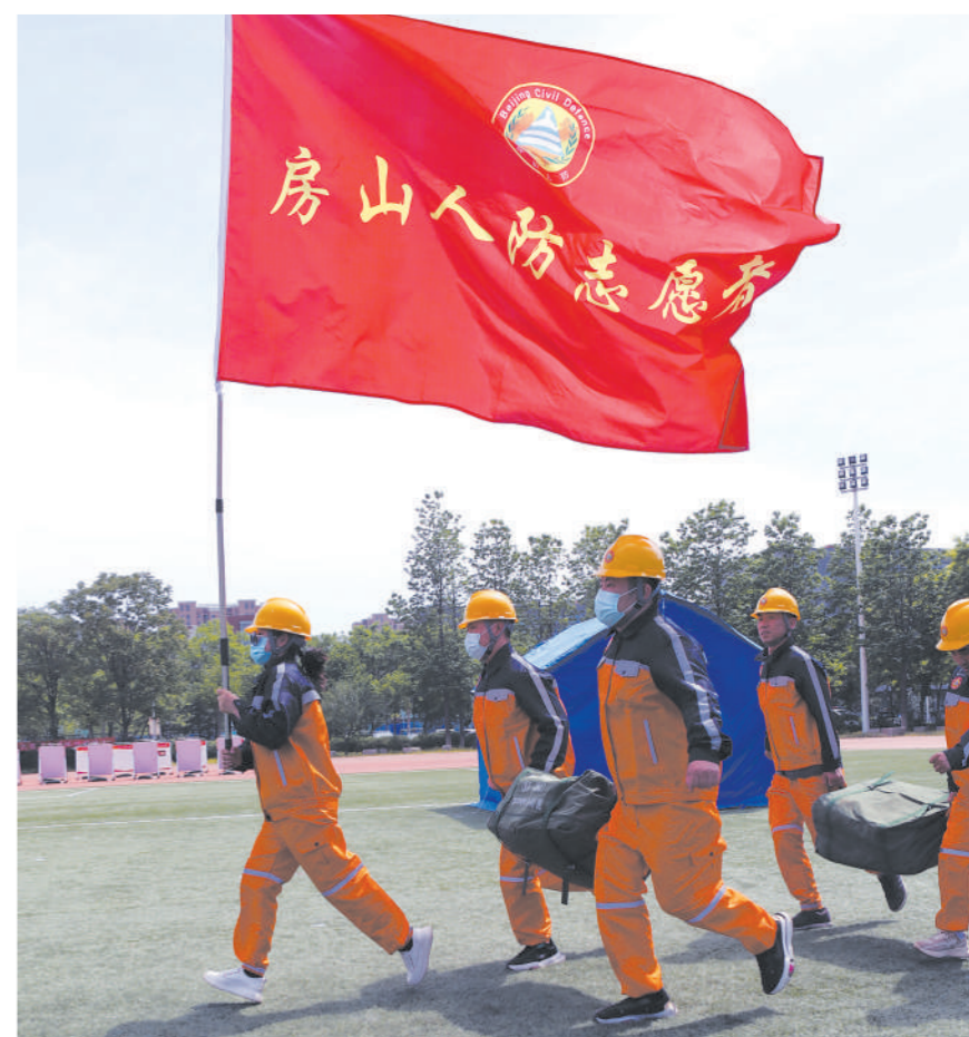
5月10日,首都人防部门依托北京理工大学良乡校区组织开展人民防空演练,着力提高人防志愿者和学校师生的应急救援能力。图为参演志愿者紧急出动。