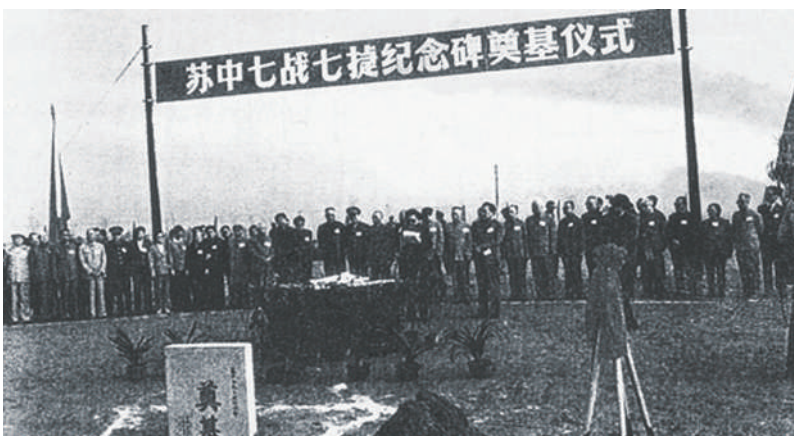
1986年10月8日，中共江苏省委在海安县隆重举行苏中七战七捷40周年纪念大会及苏中七战七捷纪念碑奠基典礼

苏中战役中，我军在初战宣泰、二战如南取得重大胜利并组织主力部队休整待机期间，并未消极待战，而是以一部力量在海安及其以南、以西地区实施运动歼敌，“为华中野战军主力赢得了宝贵的休整时间”。在主力得到充分休整后，我军迅速集中兵力，歼灭李堡之敌，打破敌人迅速“清剿”苏中地区的美梦，迫使敌方重新调整部署、修改计划。这为我军后续乘胜直插敌军封锁圈中部的丁堰、林梓，坚守邵伯阵地抗敌轮番进攻，主动迎击歼敌于如黄路，并最终取得七战七捷的重大胜利奠定了坚实基础。