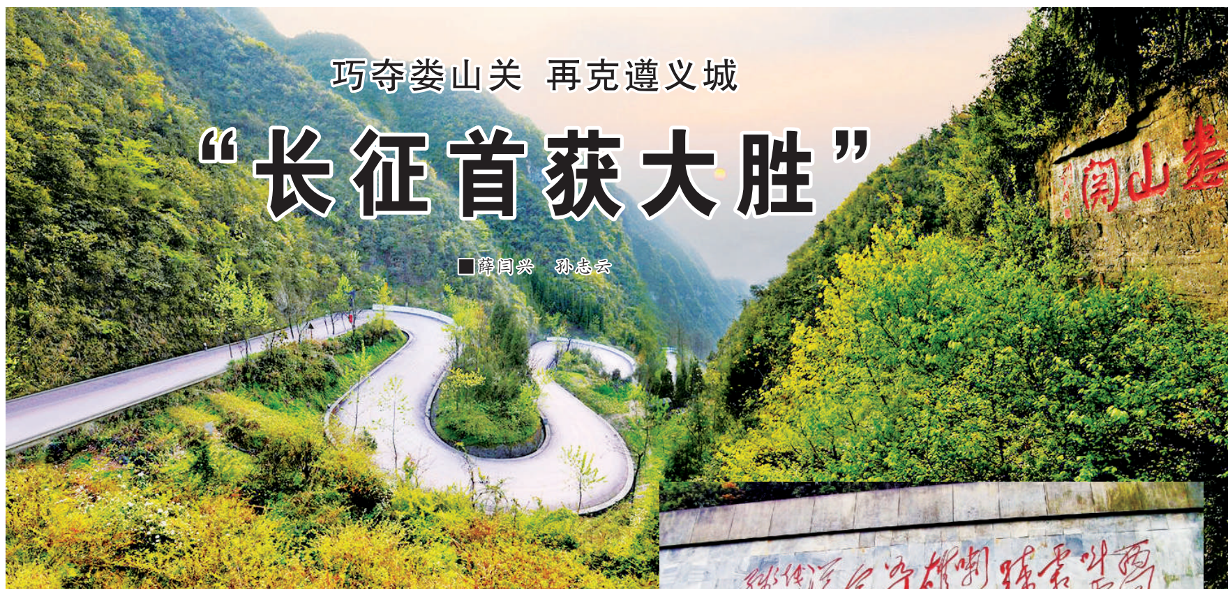
巧夺娄山关 再克遵义城