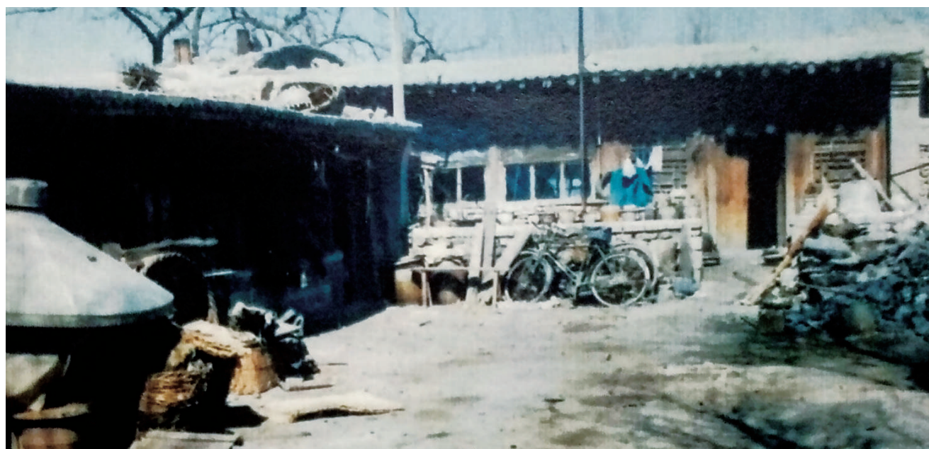
1947年中共冀察热辽中央分局社会部情报处锦西情报站在暖池塘村的办公地址

1948年6月，由于我军在东北与国民党军的军力对比已发生明显变化，毛泽东决定发起战略决战。辽沈战役的关键一战，便是攻克辽宁锦州。