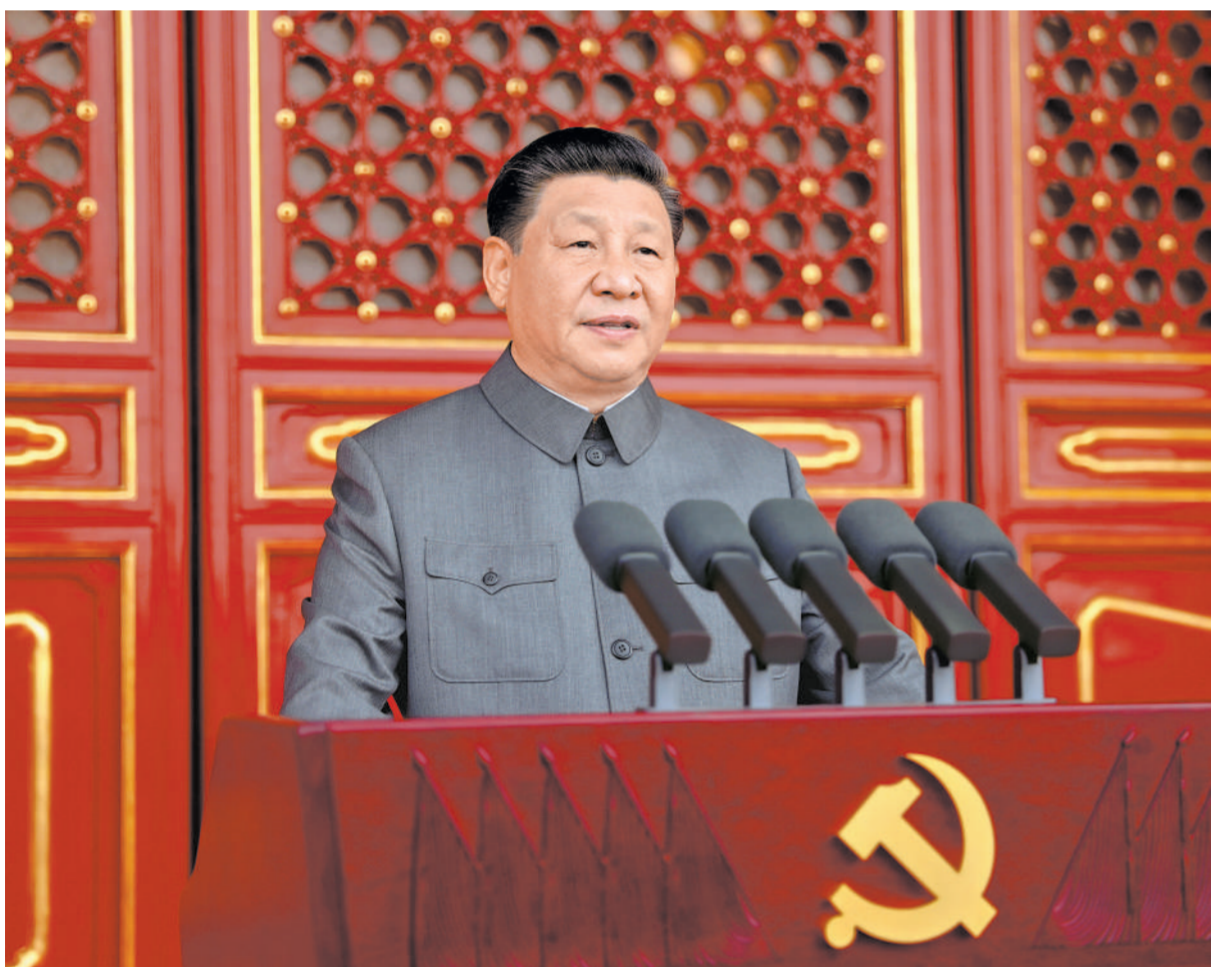
7月1日,庆祝中国共产党成立100周年大会在北京天安门广场隆重举行。中共中央总书记、国家主席、中央军委主席习近平发表重要讲话。