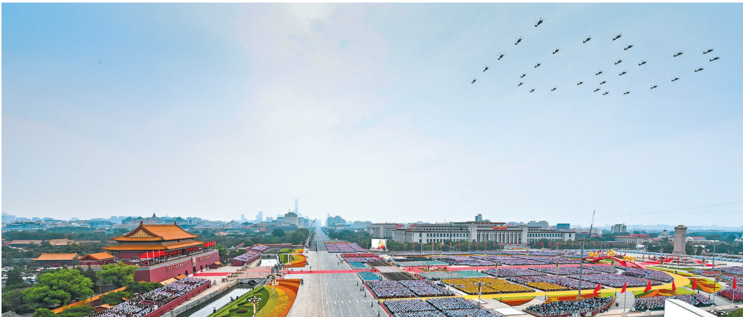
七月一日,庆祝中国共产党成立一百周年大会在北京天安门广场隆重举行。

神州大地欣欣向荣、气象万千,首都北京花团锦簇、旌旗飘扬。在伟大的中国共产党领导下,近代以后久经磨难的中华民族迎来了从站起来、富起来到强起来的伟大飞跃。(下转第三版)