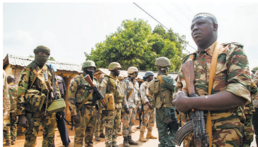
中非共和国政府军

对此,俄军事专家认为,该报告并不具有说服力,其指控仅基于个别目击者的证词,且目击者的身份难以确定。该指控是将反政府武装所犯下的罪行强行安在俄军事教官身上。