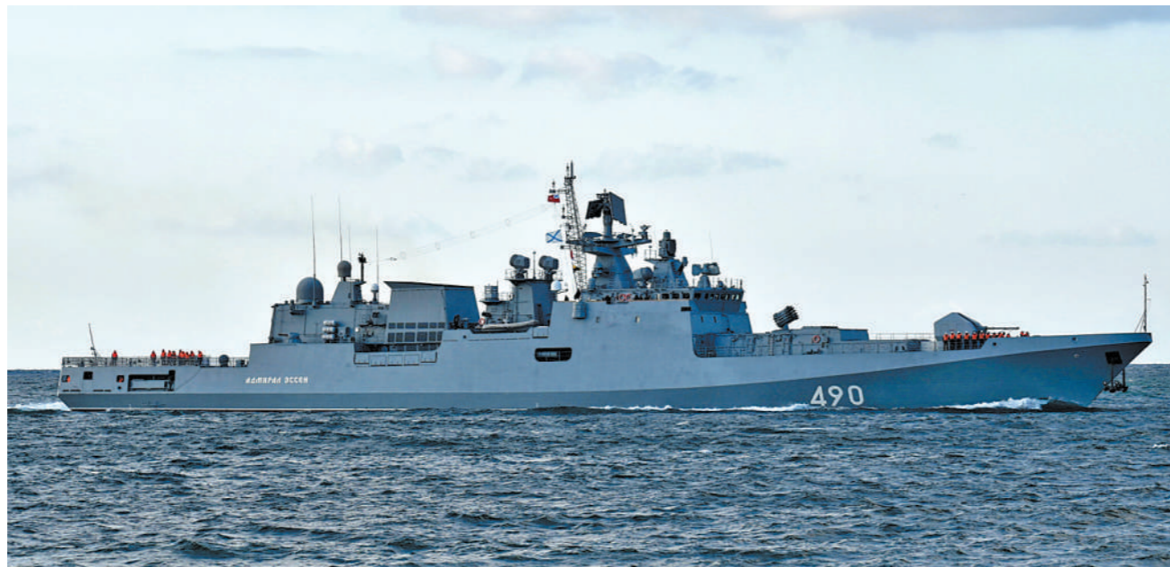
俄“埃森海军上将”号护卫舰

俄美领导人会晤后仅4天,美国总统国家安全事务助理沙利文称,美国正准备就俄罗斯反对派人士纳瓦利内事件对俄罗斯实施新制裁。美国政府还警告称,如果纳瓦利内在狱中死去,将给俄罗斯带来“毁灭性”后果。此外,据俄罗斯卫星通讯社报道,欧盟方面决定再次延长对俄经济制裁。报道称,欧洲理事会主席米歇尔在社交媒体发文称,欧盟决定在金融、能源和国防等领域延长对俄制裁,并禁止向俄方提供和出售部分石油生产及勘探