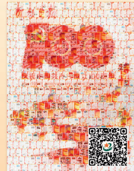
2亿像素，特刊全景看